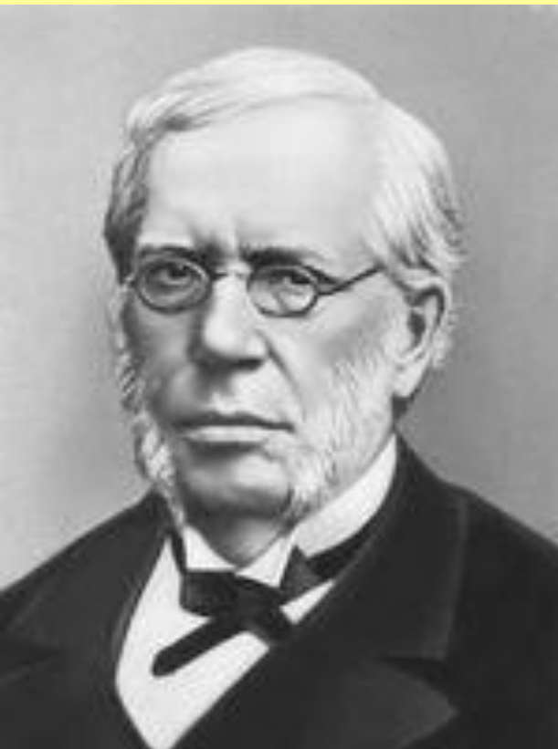
Вышнеградский Иван Алексеевич (1830–1895), министр финансов в 1886–1892 гг.

Известный ученый-механик. Одновременно – крупный делец. 1890 г. – сокращение полномочий фабричной инспекции, разрешение ночного труда женщин и подростков, найма на работу детей с 10 лет.