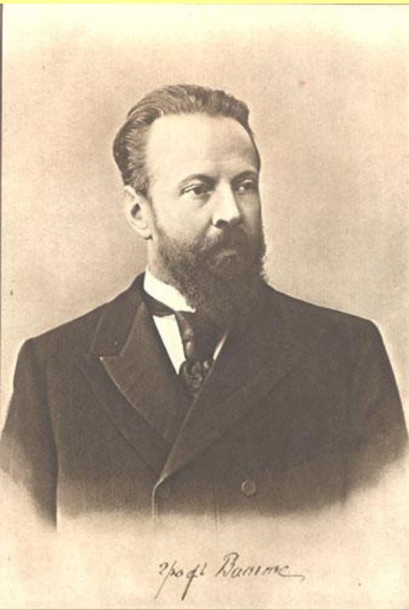
С.Ю. Витте, министр финансов.

В 1889 г. Витте назначен директором Департамента железнодорожных дел Министерства финансов, в феврале 1892 г. – управляющим Министерством путей сообщения, в августе 1892 г. – министром финансов. В 1-й половине 1880-х гг. Витте, будучи сторонником славянофильских взглядов, возражал против «обращения хотя бы части русского народа в несчастных рабов капитала машин».