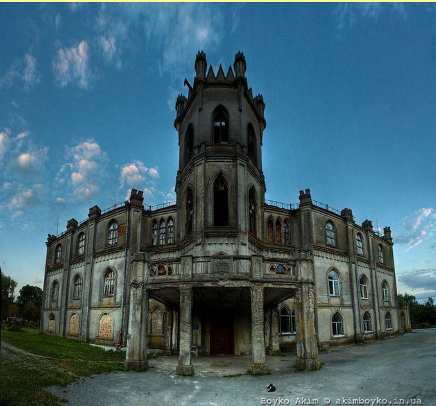
Дворец сахарозаводчика Ф. Терещенко в местечке Червоное под Житомиром.

Синдикат сахарозаводчиков ввел «нормировку» для каждого завода с обязательством продавать весь произведенный сверх нормы сахар за границей. В Европе русский сахар стоил 2 р.08. коп./пуд, а в России – 6 р. 15 коп./пуд.