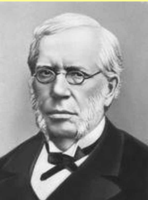
Вышнеградский Иван Алексеевич (1830–1895), министр финансов в 1886–1892 гг.

Известный ученый-механик. Одновременно – крупный делец. 1890 г. – сокращение полномочий фабричной инспекции, разрешение ночного труда женщин и подростков, найма на работу детей с 10 лет.