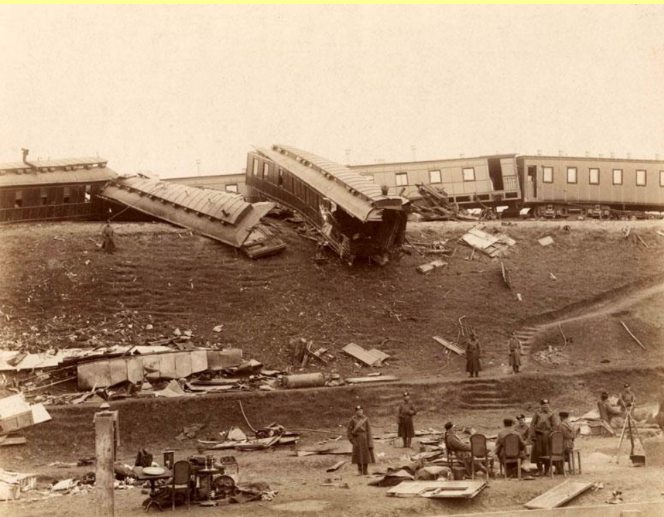
Катастрофа императорского поезда близ ст. Борки Курско-Харьковско- Азовской железной дороги. 17 октября 1888 г.

В 1888 г. императорский поезд потерпел катастрофу близ станции Борки. Крушение было следствием чрезмерно высокой скорости тяжелого царского поезда, которого легкие рельсы и деревянные шпалы не выдержали. Витте предупреждал об опасности скоростной езды, но его не послушали. После крушения царь вспомнил упрямого чиновника.