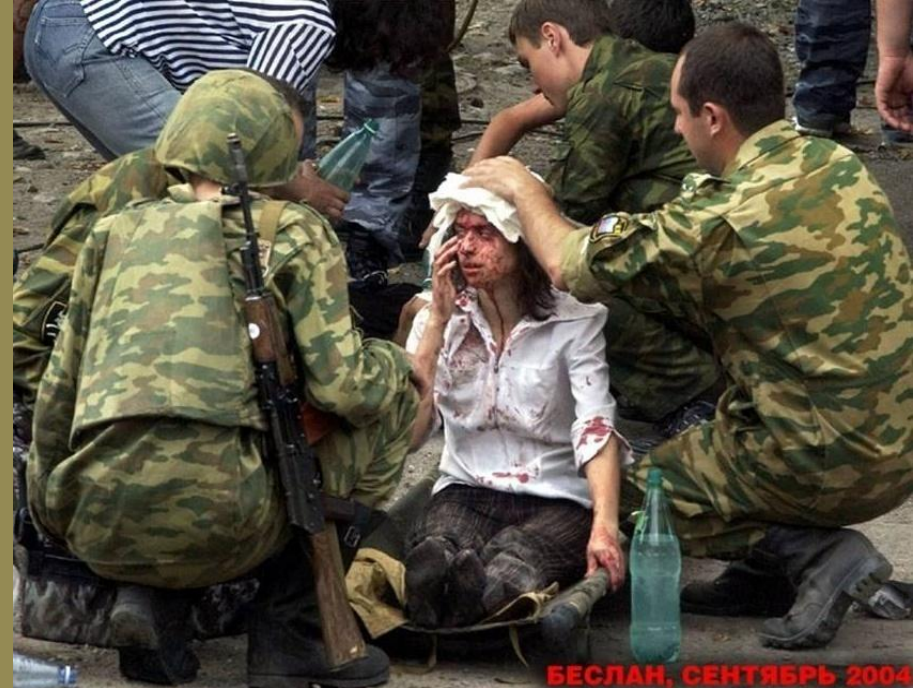
БЕСЛАН, СЕНТЯБРЬ 2004

Важно также иметь твёрдую установку на неприятие терроризма, чтобы на все подозрительные уговоры сказать решительное «Нет!».