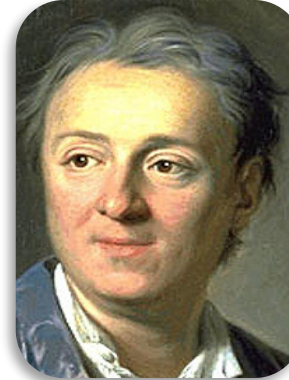
ШАРЛЬ ЛУИ МОНТЕСКЬЕ (1689-1755) ФР. ПРАВОВЕД, ПИСАТЕЛЬ

РАЗДЕЛЕНИЕ ВЛАСТЕЙ И ИХ ОСНОВНЫЕ ФУНКЦИИ