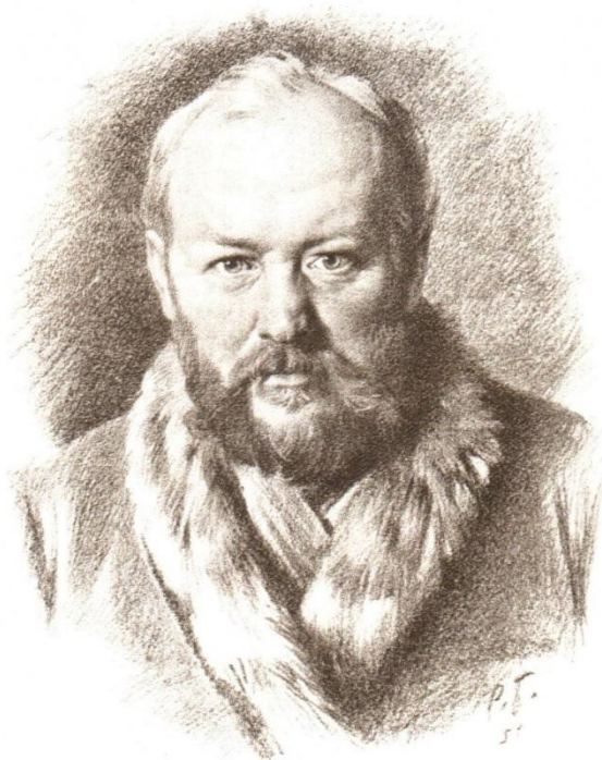
Александр Николаевич ОСТРОВСКИЙ (1823—1886)