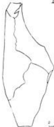
Рис.1,2.Нуклеусы 3. Схема нуклеуса