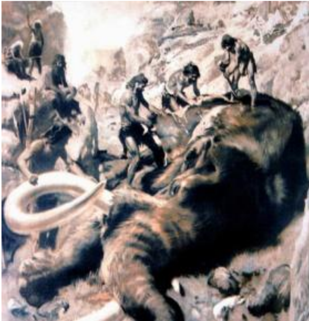
Охота на мамонта