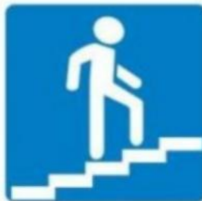
Надземный пешеходный переход