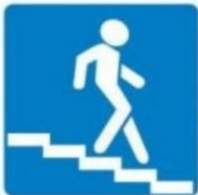
Подземный пешеходный переход