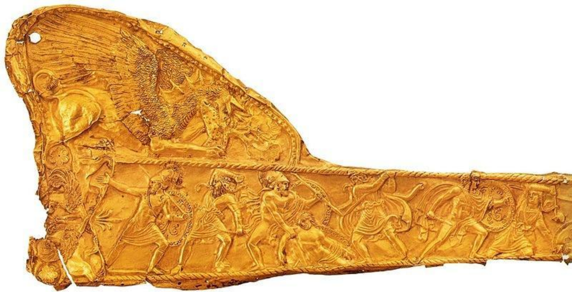
Ножны. Фрагмент. Конец 5 - начало 4 века до н. э. Золото, чеканка. Государственный Эрмитаж, Санкт-Петербург. Изображены сцены битвы между варварами и греками. Найдены в кургане Чертомлык, близ Никополя