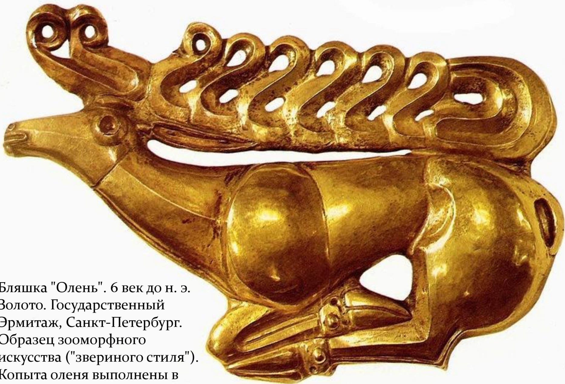
Бляшка "Олень". 6 век до н. э. Золото. Государственный Эрмитаж, Санкт-Петербург. Образец зооморфного искусства ("звериного стиля"). Копыта оленя выполнены в виде "большеклювой птицы".