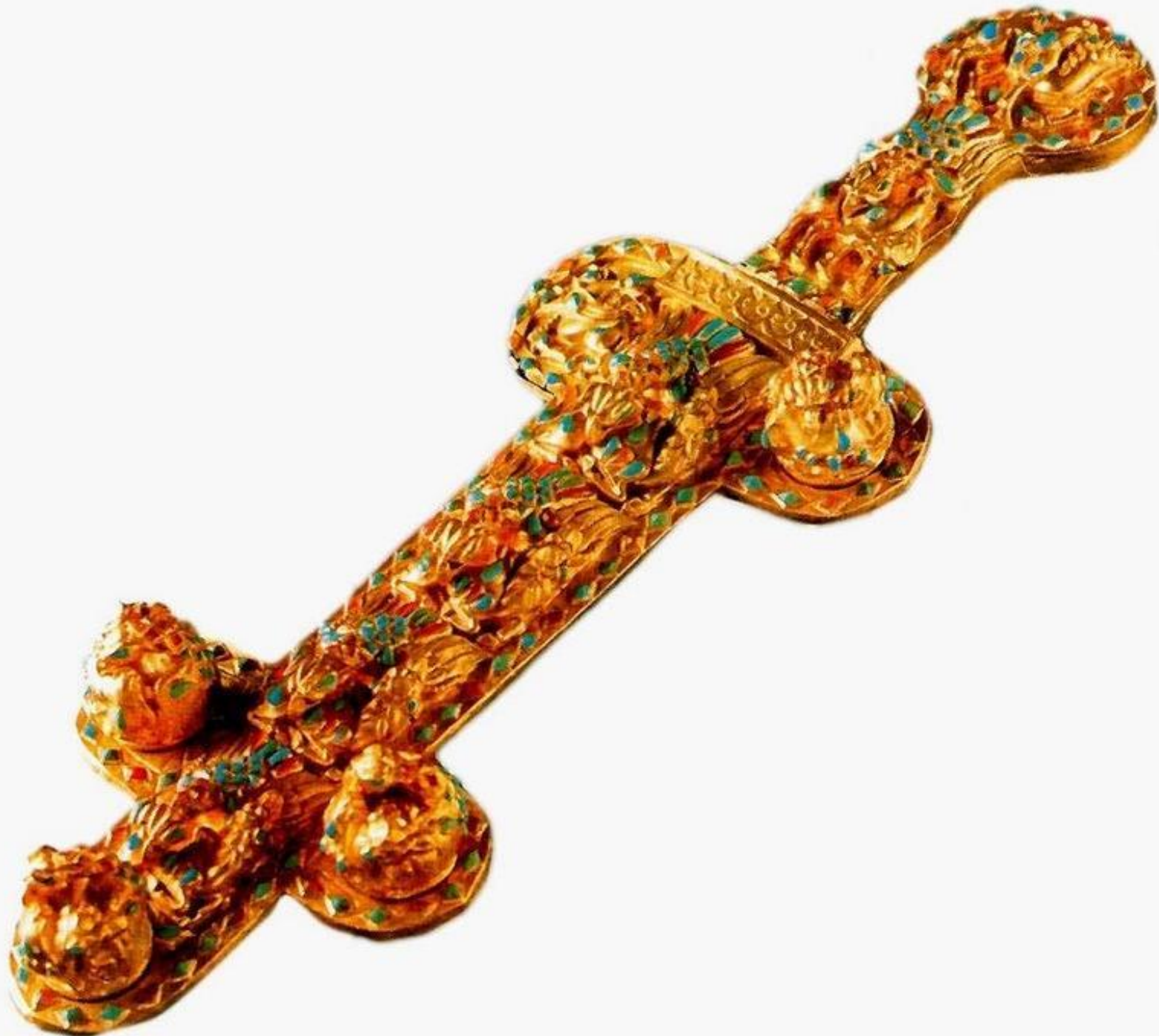
Кинжал. Вторая половина 1 века н. э. Золото, гранат, бирюза.