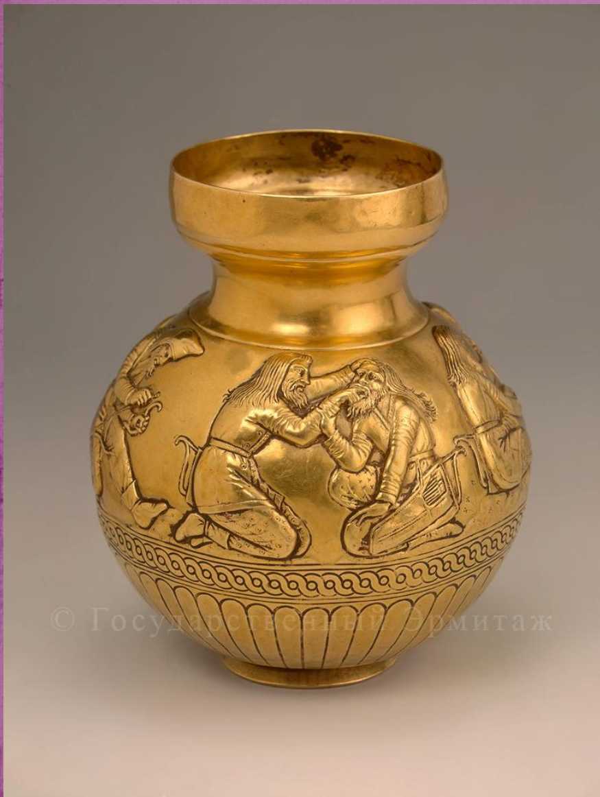
Кубок из кургана Куль-Оба