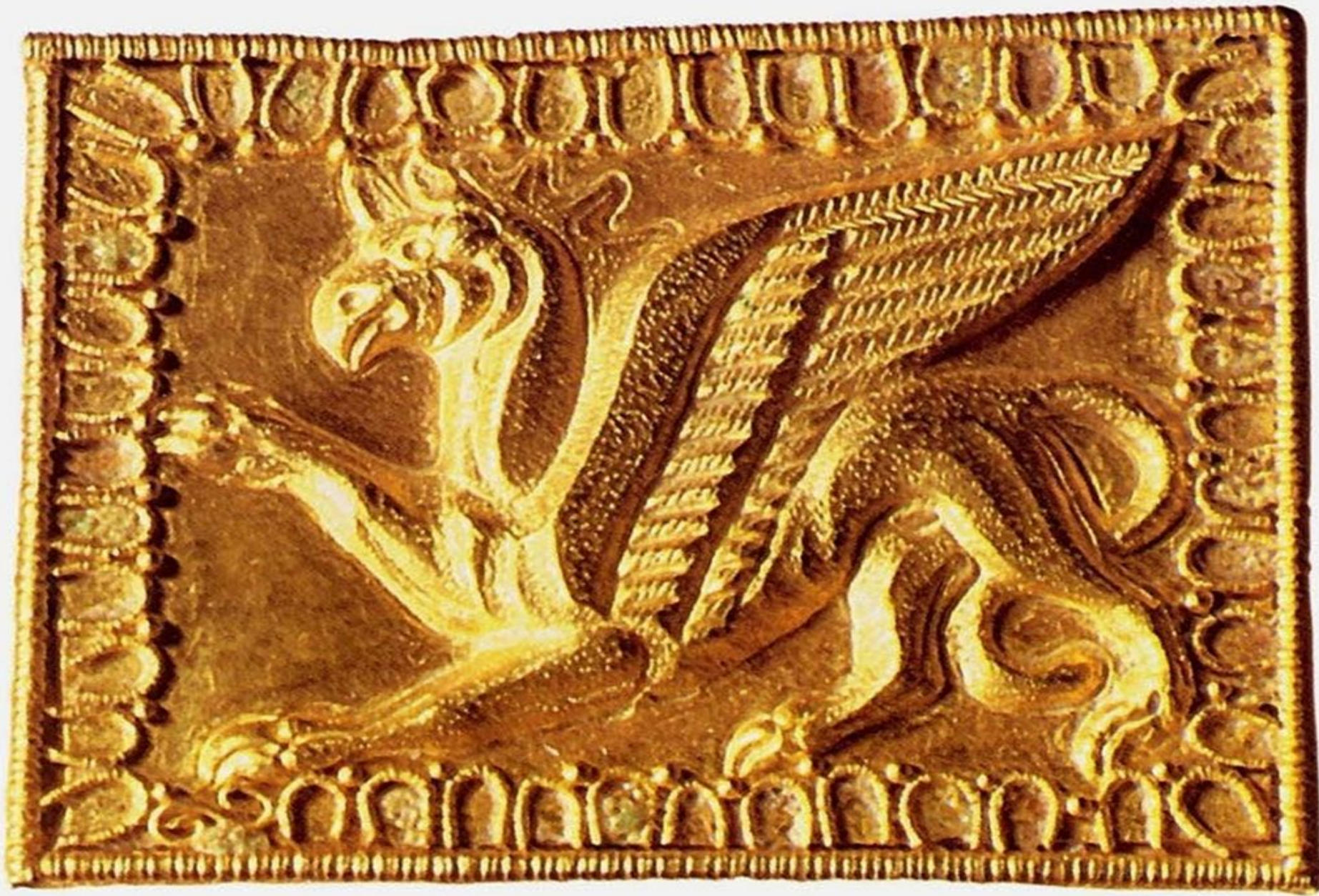
Прямоугольная бляшка с изображением грифонов. Музей Троговитца. Предназначались для украшения оружия.