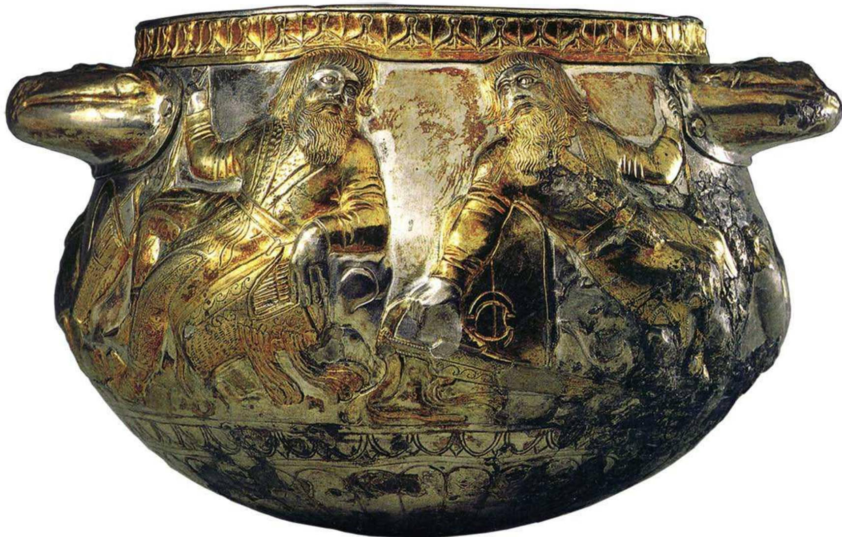
Чаша из Гаймановой могилы