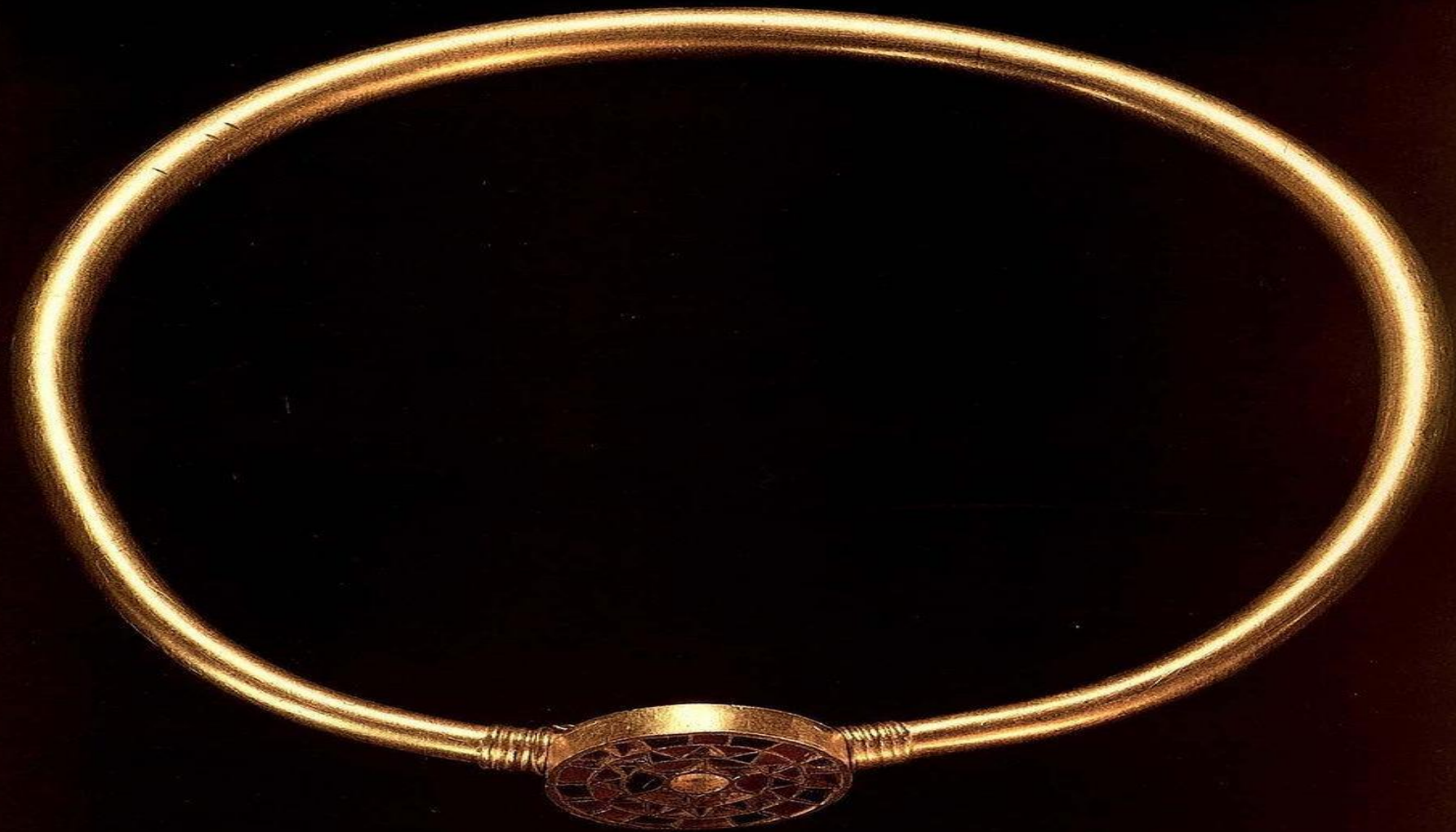
Шейная гривна. 4 - 5 век. Золото, стекла; литье. Диаметр 22 см. Государственный историко-культурный музей-заповедник "Московский Кремль". Оружейная палата, Москва. Найдено в Северном Причерноморье.