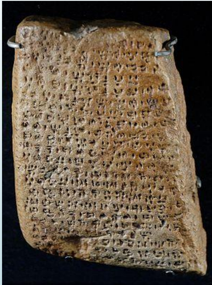
Табличка с надписью криптоминойским письмом.

В этеокритской надписи греческим алфавитом из Психро III слово επίθι продублировано критскими знаками линейного письма А как i-ri-ti. В настоящее время большинство исследователей считают надпись подделкой; иные свидетельства существования эгейского письма на Крите и в материковой Греции после «бронзового коллапса» отсутствуют.