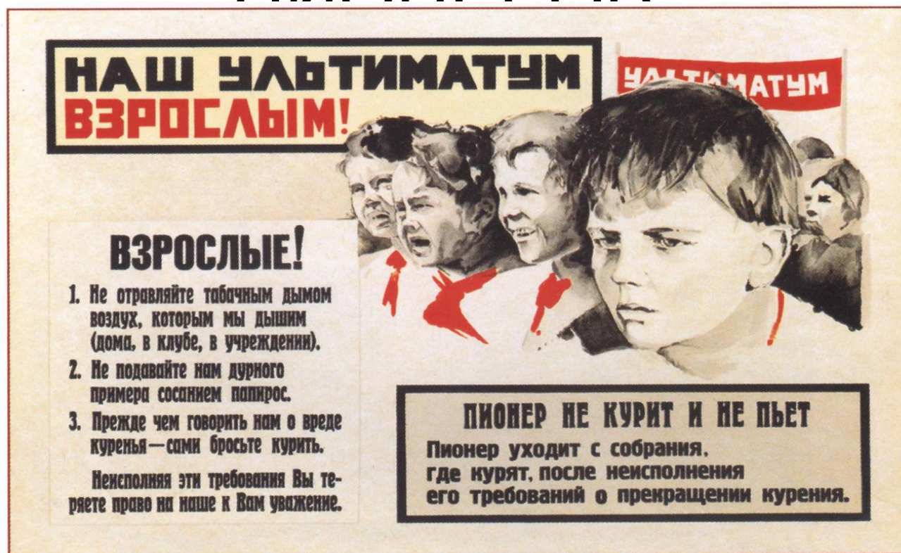
453. Неизвестный художник Наш ультиматум взрослым! 1930