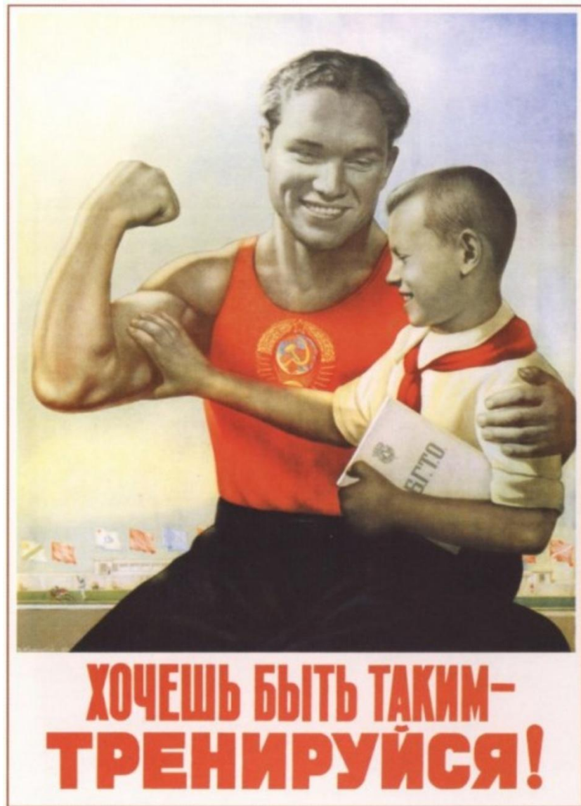
510. Корецкий В. Хочешь быть таким — тренируйся! 1951

Кто с зарядкой дружит смело Кто с утра прогонит лень, Будет смелым и умелым И веселым целый день!