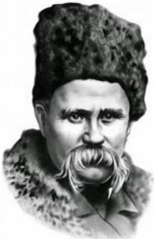
Тарас Шевченко (1814—1861)