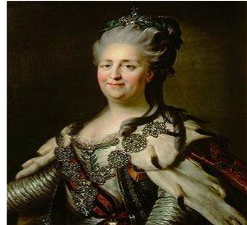
Портрет Катерини II. Роботи Жан-Баптиста Лампі