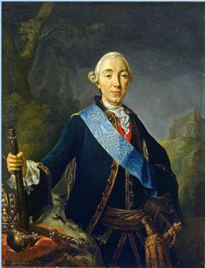
Петро III 1761—1762

Представник династії Гольштейн-Готторп-Романових Чоловік Катерини II. Батько російського імператора Павла I