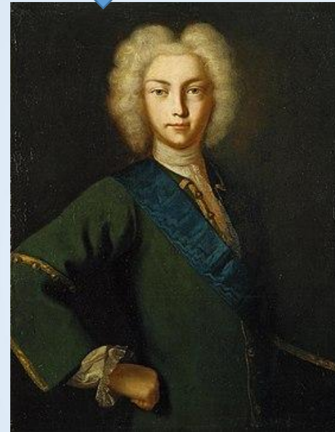
Петро II (1727-1730)