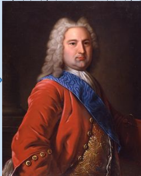
Ернст-Йоганн фон Бірон