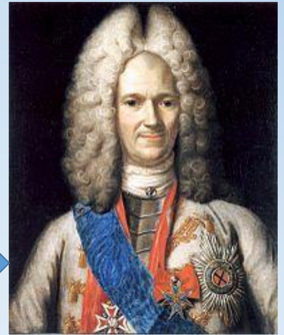
князь О. Меншиков