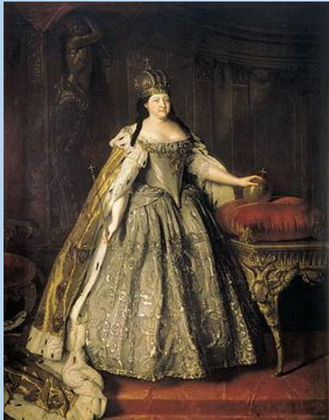
Анна Іоанівна 1730-1740