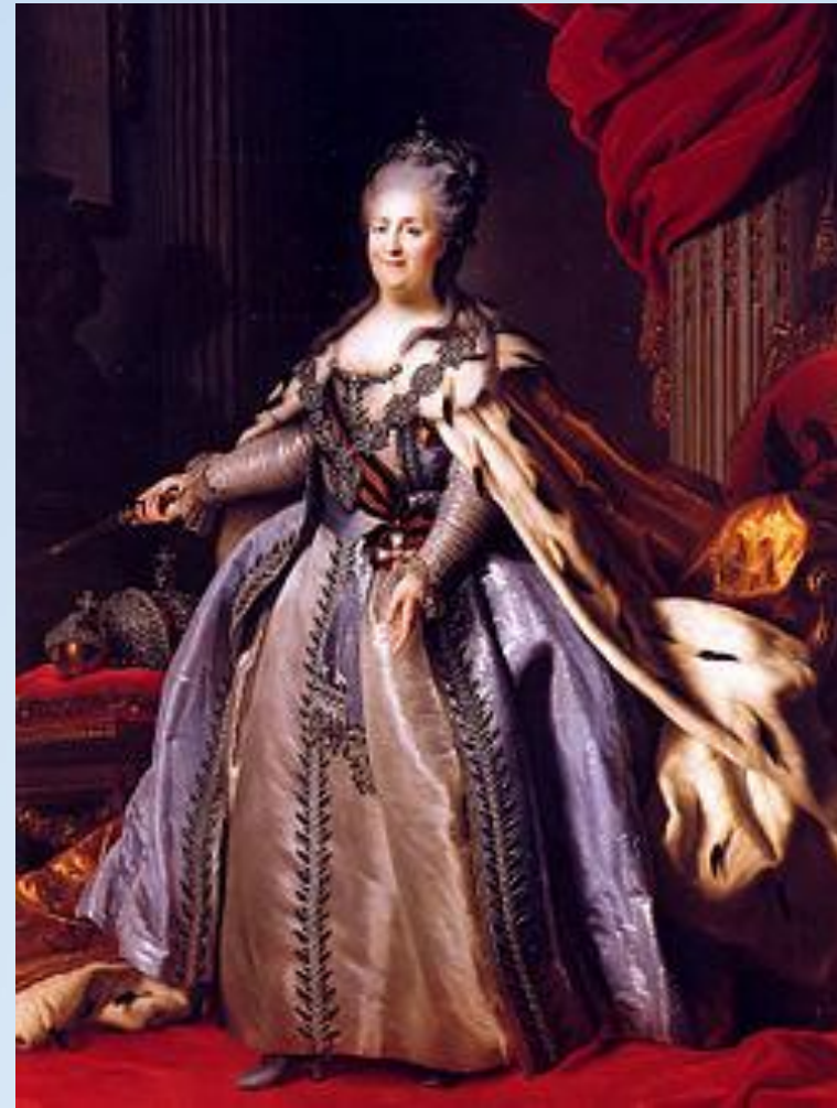
Катерина II 1762—1796

Представник династії Гольштейн-Готторп-Романових Чоловік Катерини II. Батько російського імператора Павла I