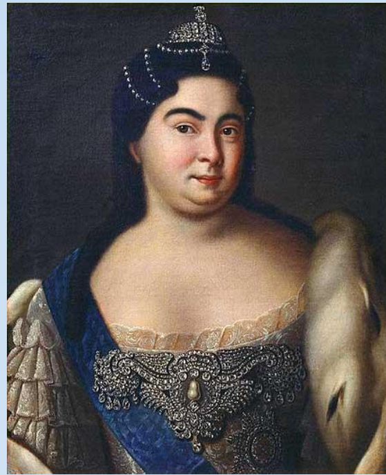
Катерина I (1725–1727 рр.)

Взагалі другу чверть XVIII ст. нерідко називають епохою палацових переворотів і правління фаворитів.