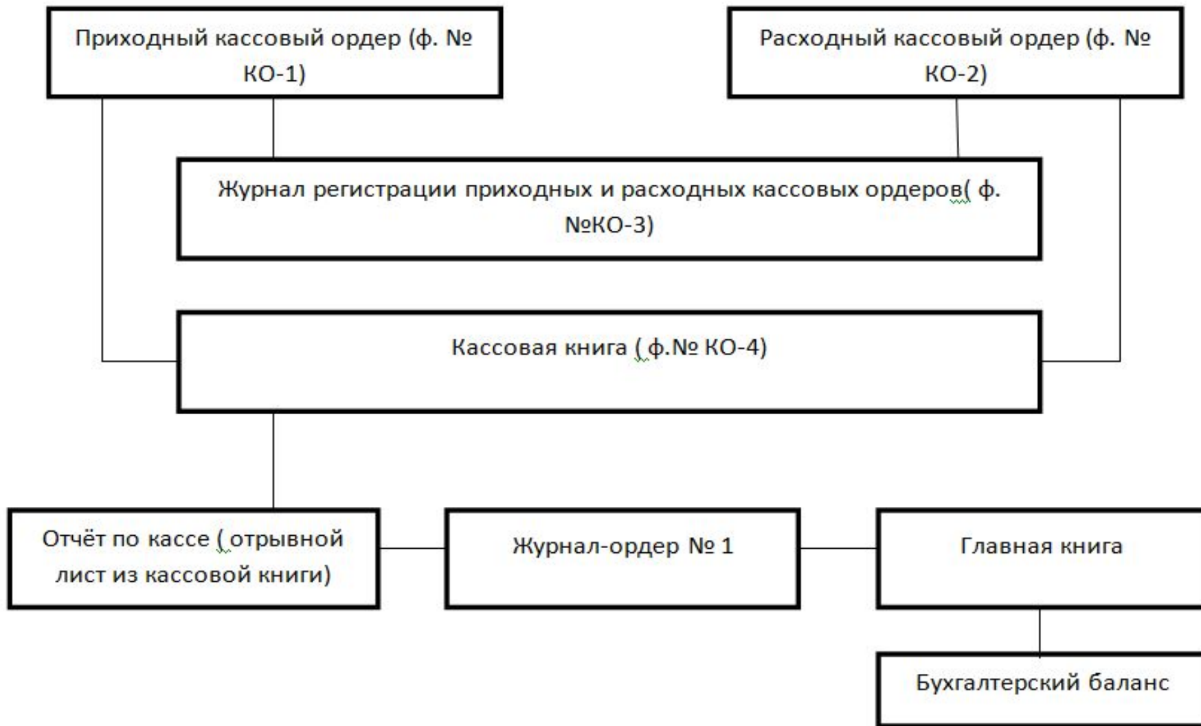
Рисунок 3 – Схема учета денежных средств в ПО Хлеб г. Лукоянов Нижегородской области