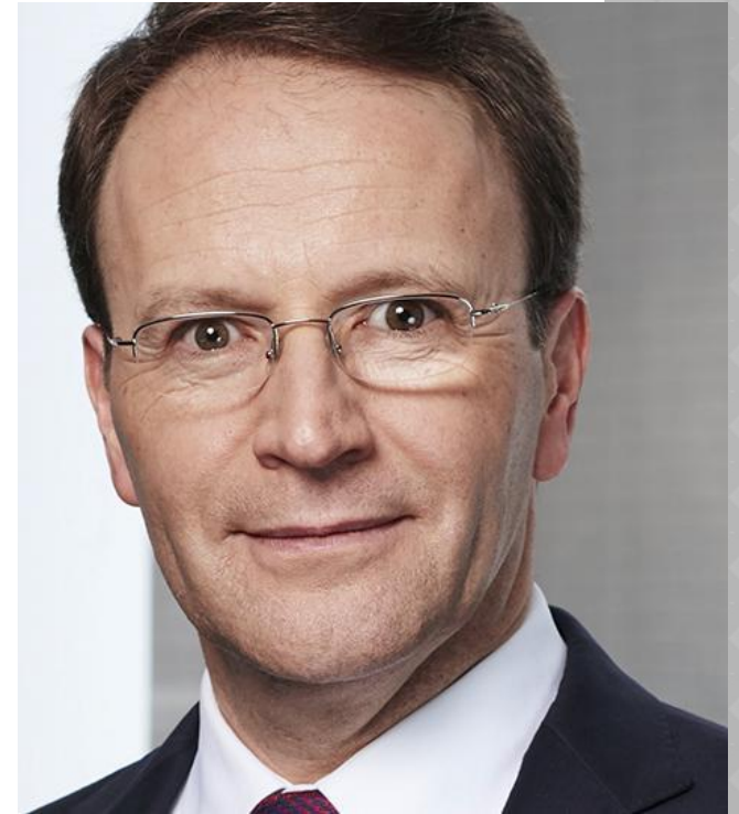
Ульф Марк Шнайдер