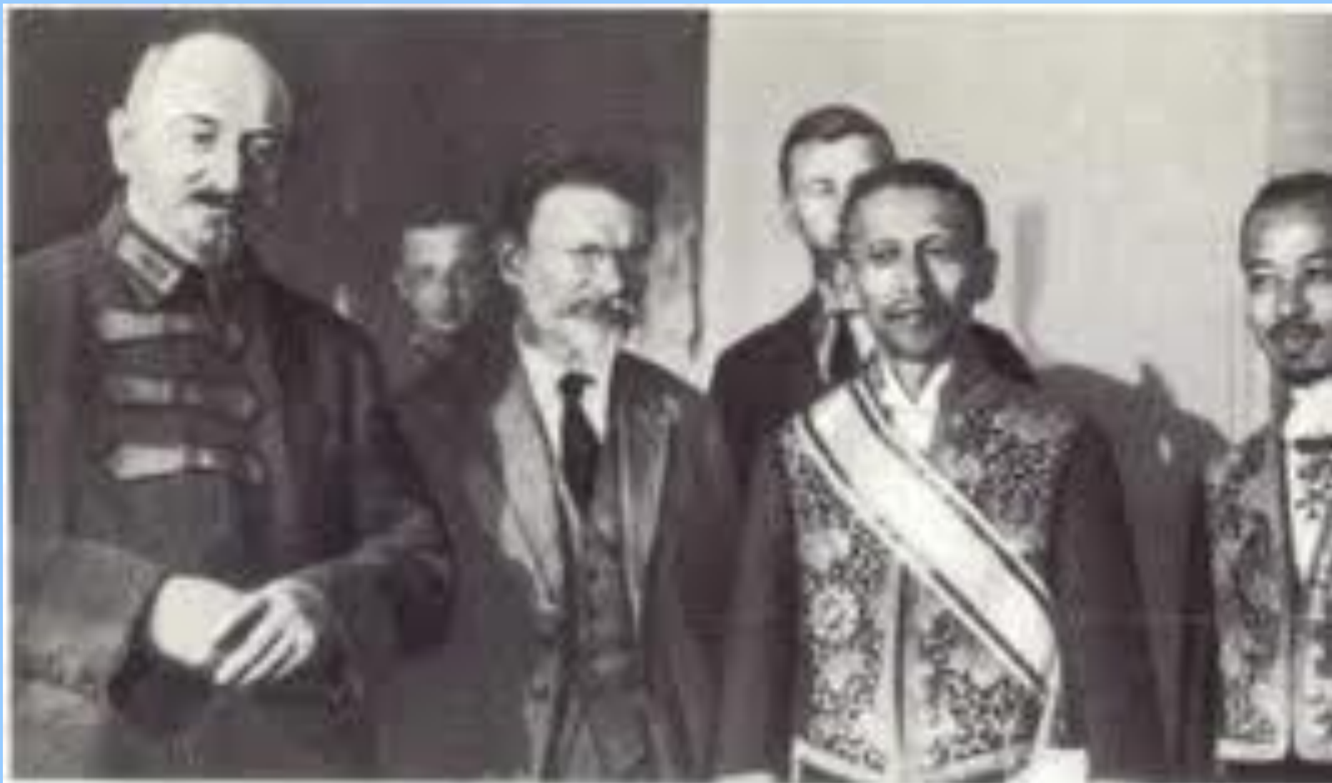
М. Н. Калинин и Г. В. Чичерин при вручении послом Японии верительных грамот, Москва, 1925 г.