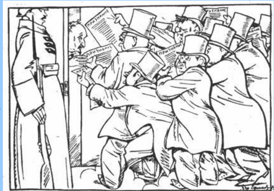
Спешат признать. Рис. Бор. Ефимова. («Известия», 6 февраля 1924 г.)