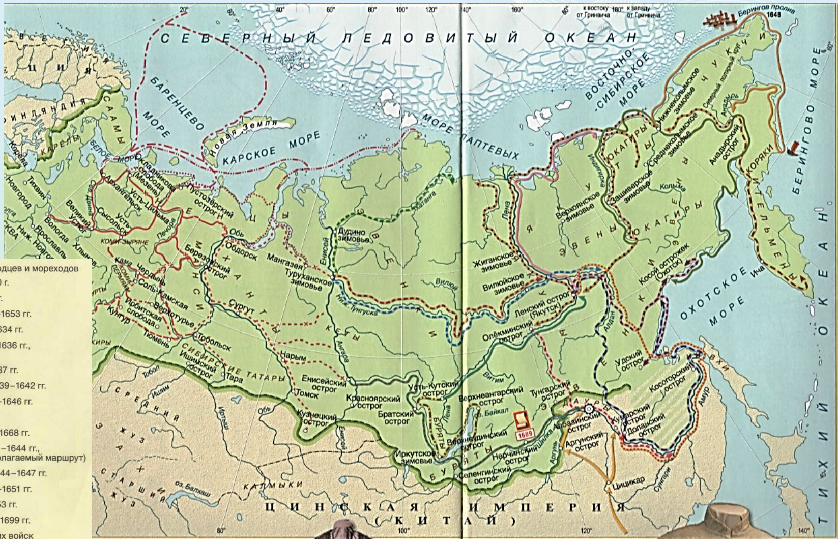
Походы русских землепроходцев и мореходов