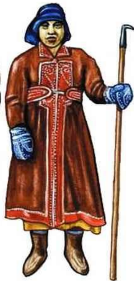
Эвенки и эвены