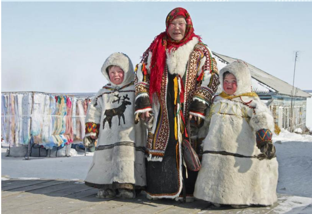
Ханты и манси