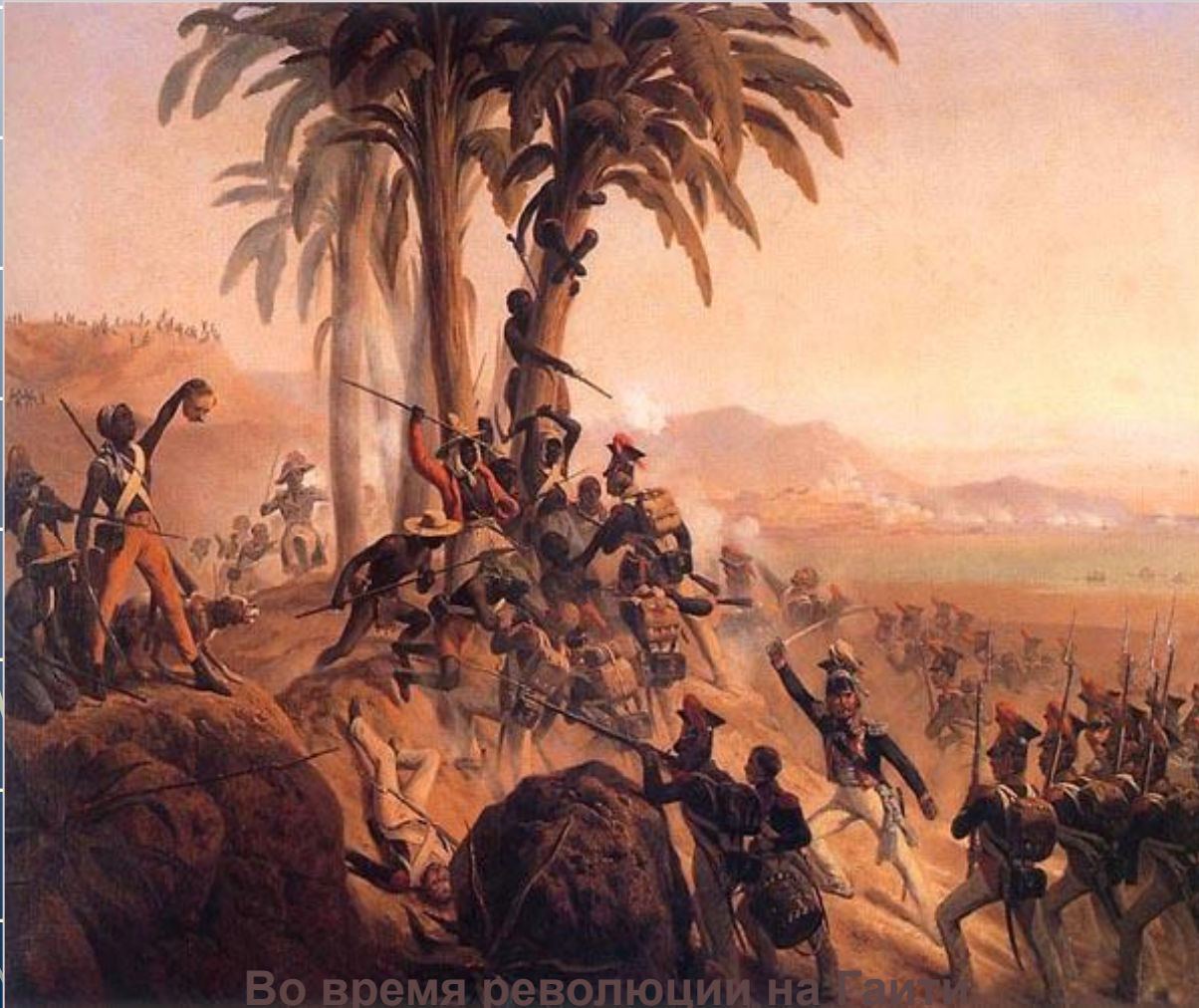
Во время революции на Гаити