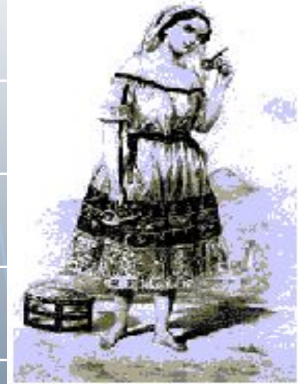
Жительница Асунсьона времен доктора Франсии