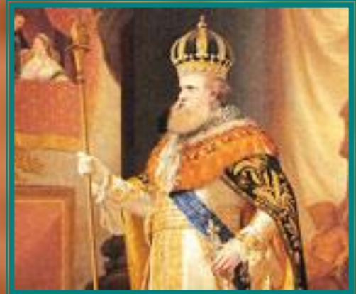
Император Бразилии Дон Педро II, 1873

на северо-востоке продолжали выращивать сахарный тростник, на крайнем юге и дальнем западе разводили скот, а на севере основными культурами были хлопчатник, индигофера и рис, развивалась добыча полезных ископаемых. В середине 19в. в Бразилии была построена первая железная дорога из Рио-де-Жанейро в Петрополис. В 1877г. в Бразилии был построен первый сахарорафинадный завод, использовавший энергию пара.