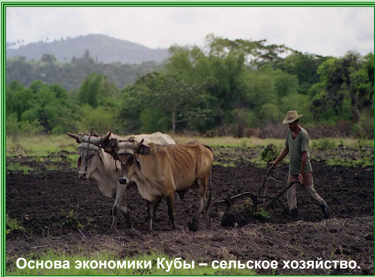
Основа экономики Кубы – сельское хозяйство.

и Великобритания провозгласила свободу торговли, что способствовало оживлению экономической жизни острова. Через год Испания была вынуждена ослабить режим торговой монополии на Кубе. Расширение торговли с Европой, особенно с Францией, а затем и с США вызвало общий подъём сахарного и табачного производства.