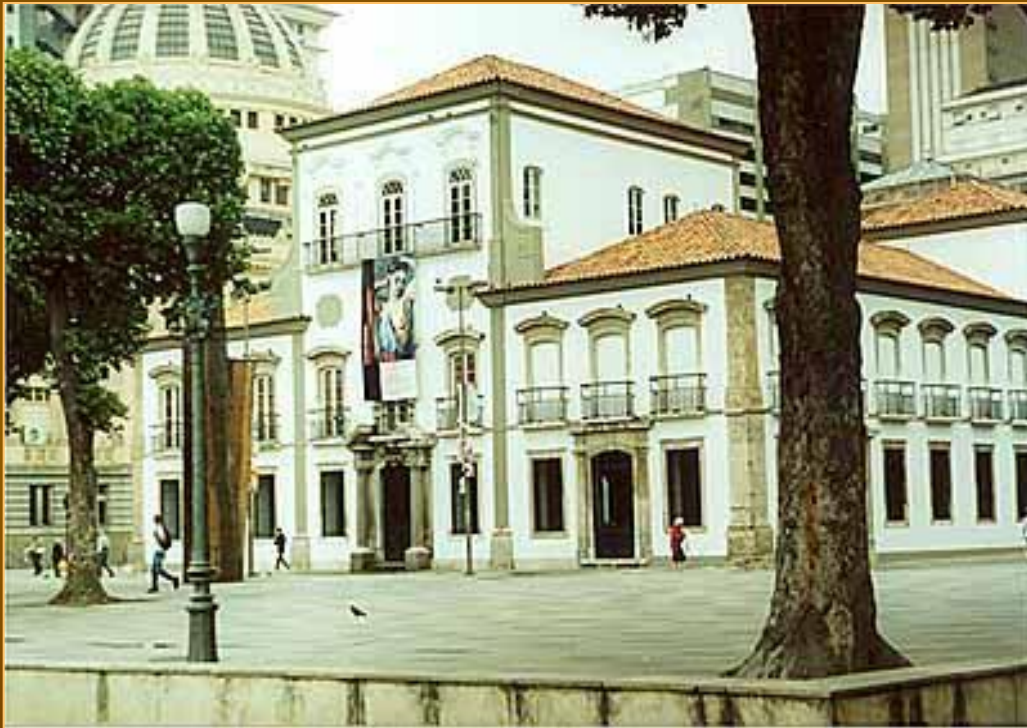
Рио-де-Жанейро. Бывшая резиденция императоров Педро I и Педро II. Здесь принцесса Изабелла подписала акт об отмене рабства.