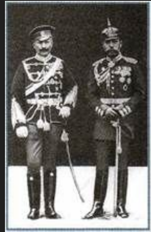
Вильгельм II и Николай II