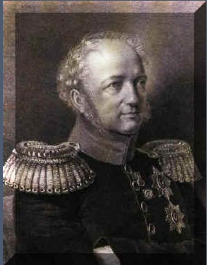
Е.Ф. Канкрин – экономику.