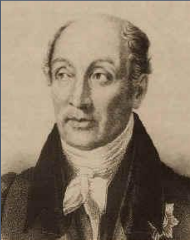
М.М. Сперанский преподавал ему право