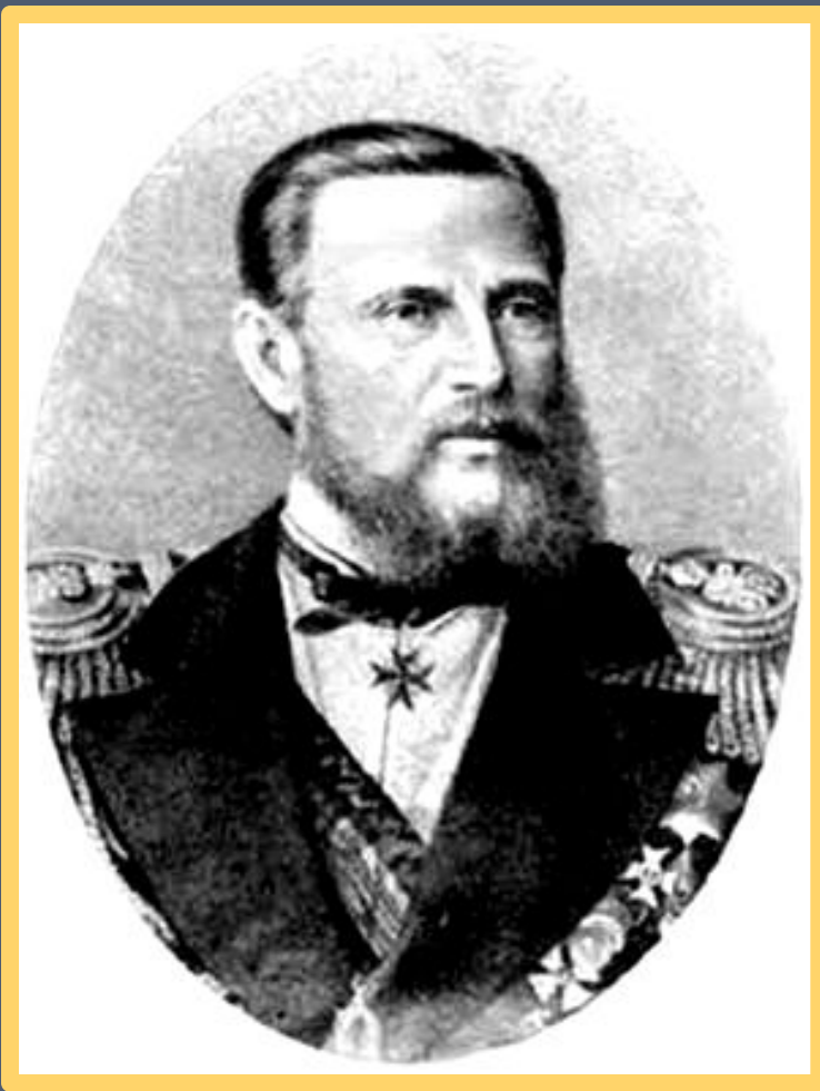
Великий князь Константин Николаевич