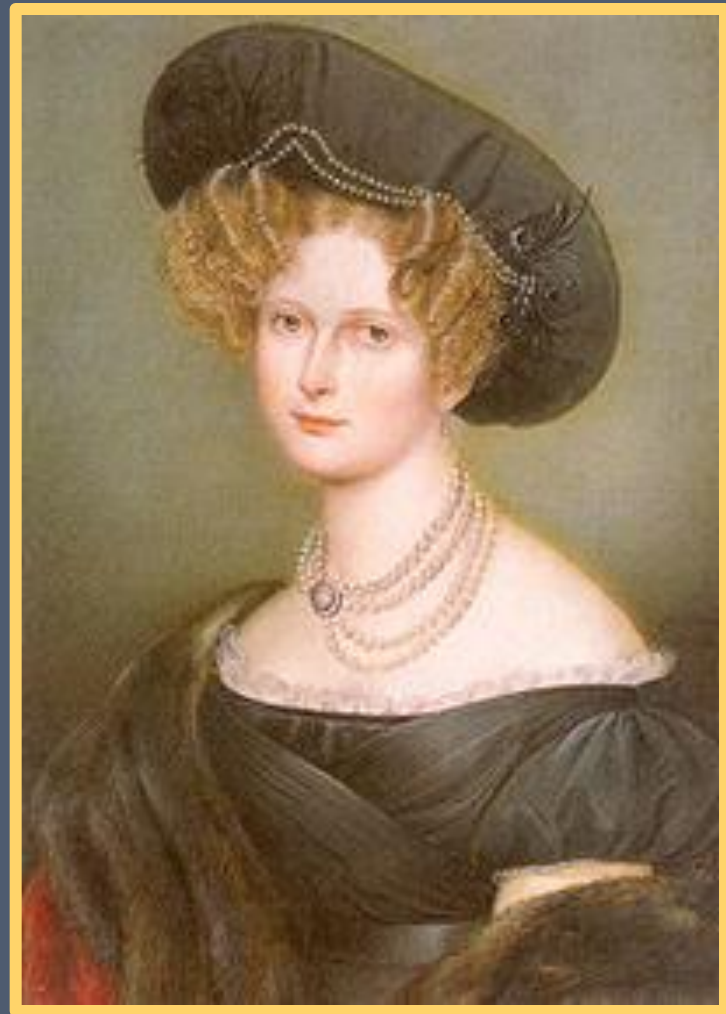
Великая княгиня Елена Павловна