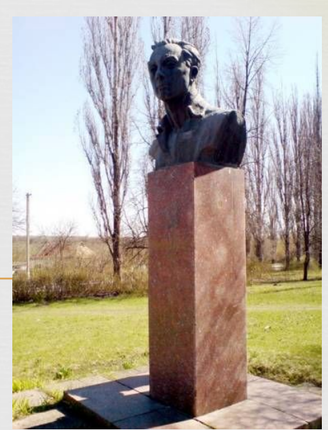
Музей Ю. Яновського в Нечаївці