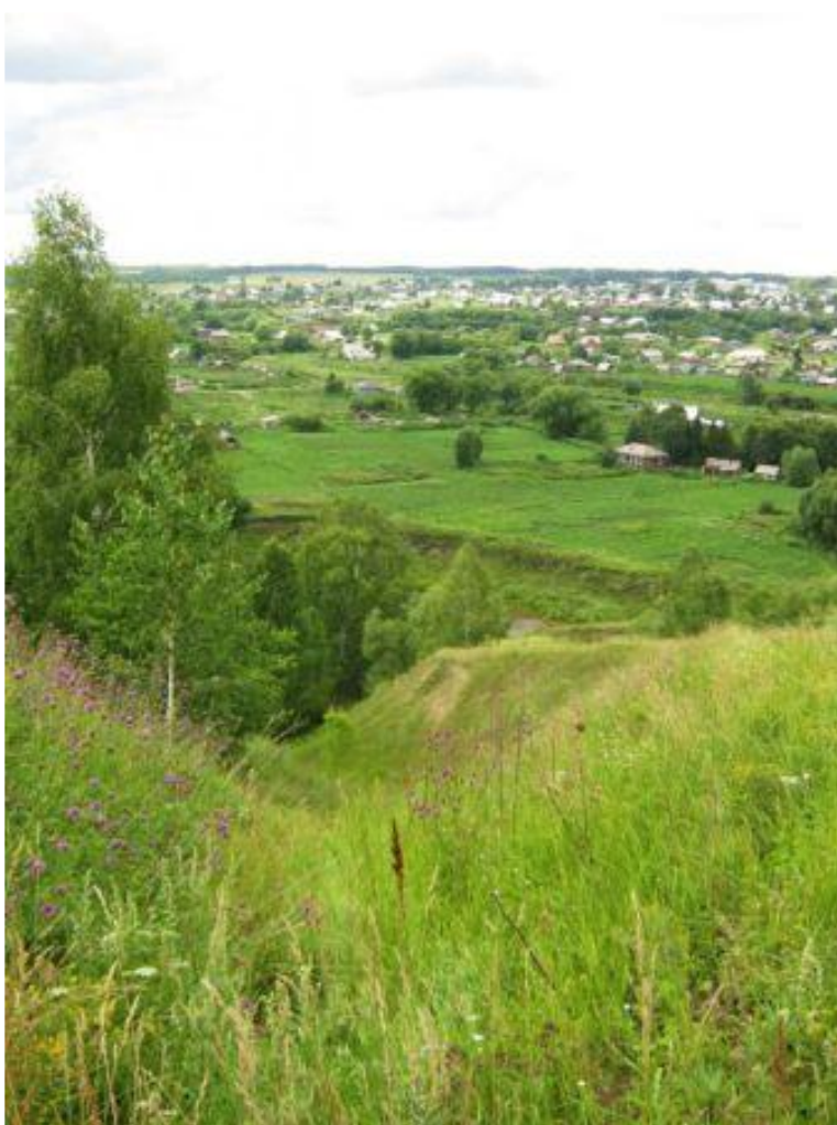
Село Косиха Алтайского края