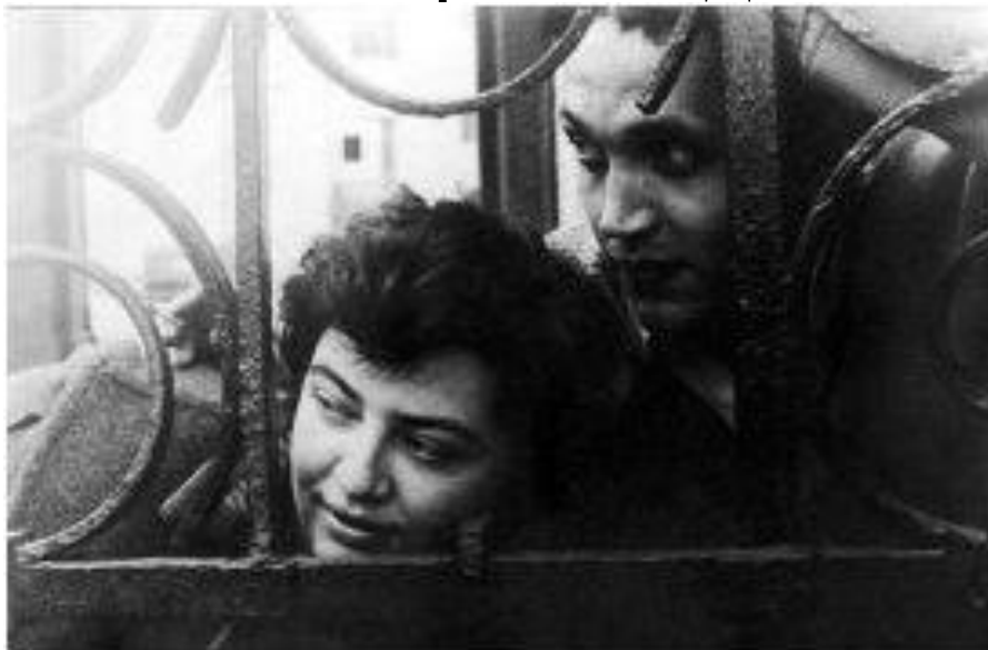
Поэт с супругой Аллой