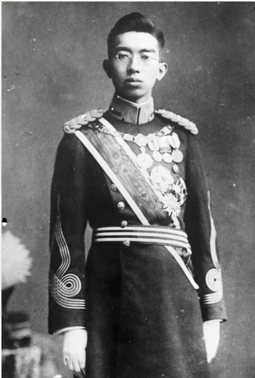
Акихито (1989 г.-по настоящее время)