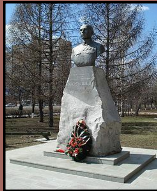
Памятник Д. М. Карбышеву , Тольятти