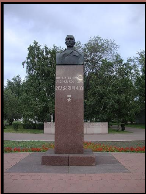
Памятник Д. М. Карбышеву, Омск