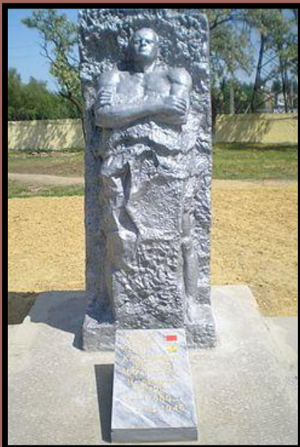
Памятник Д. М. Карбышеву, Каменск - Шахтинский