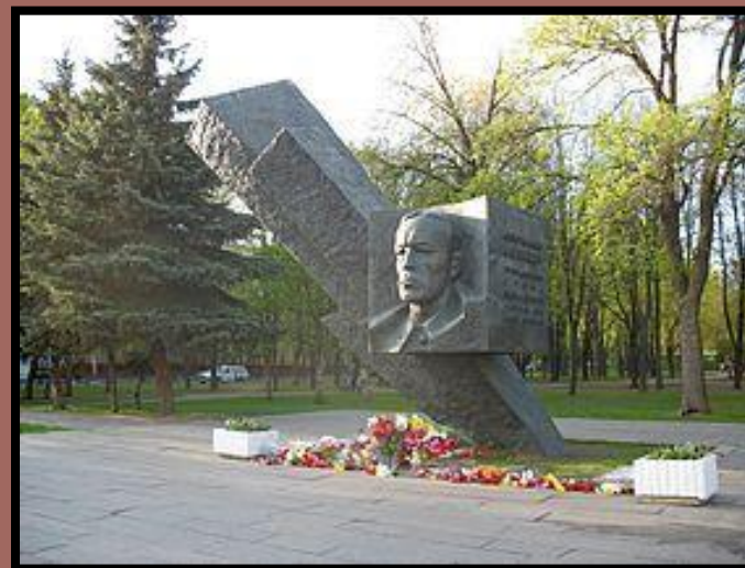
Памятник Д. М. Карбышеву, Москва