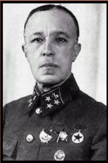
Генерал-лейтенант Д.М. Карбышев (1880 – 1945 гг.)

В Музейном комплексе хранятся личные вещи, документы героя Великой Отечественной Войны, генерал-лейтенанта инженерных войск, профессора Академии Генерального штаба Красной Армии, доктора военных наук Д. М.Карбышева. Накануне Великой Отечественной войны Д. М. Карбышев был назначен генеральным инженер - инспектором Красной армии. В начале июня 1941 года Д. М. Карбышев был командирован в Западный Особый военный округ. Через несколько месяцев штаб армии, в котором он находился, оказался в окружении. В августе 1941 г. при переправе через Днепр он был тяжело контужен и попал в плен. Он прошел через несколько концентрационных лагерей, в каждом из которых гитлеровцы всячески пытались привлечь его на свою сторону, сулили всяческие блага. Но он на все предложения фашистов непреклонно отвечал: “Родиной я не торгую”.