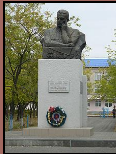
Памятник Д. М. Карбышеву , Курган