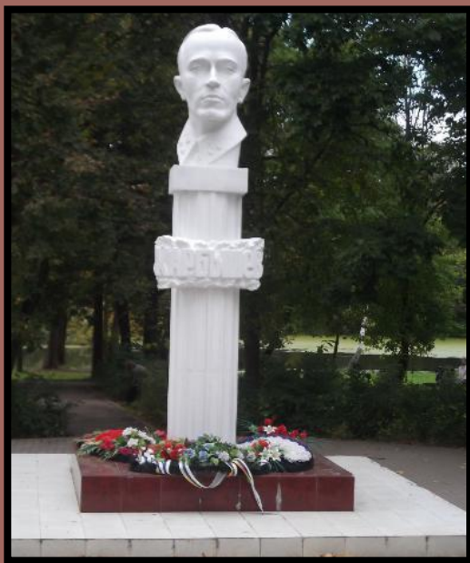
Памятник-бюст Д. М. Карбышеву , Нахибино