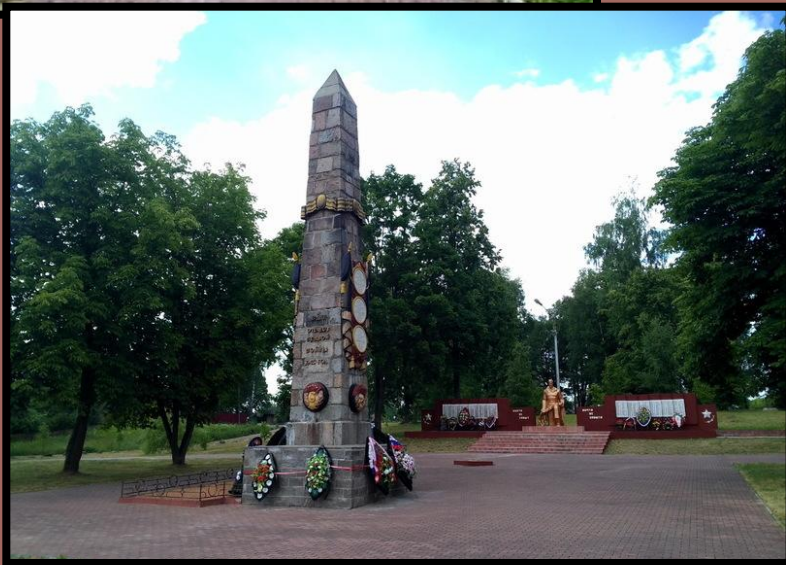
Монумент шести героям-саперам, деревня Микулино (Смоленская область)

На братской могиле в деревне Микулино 8 мая 1945 г. был открыт монумент шести героям-минерам, сооруженный представителями инженерных войск 1-го Прибалтийского фронта. В 2014 году Гимназии № 12 г. Омска было присвоено имя Героя Советского Союза В. П. Горячева.