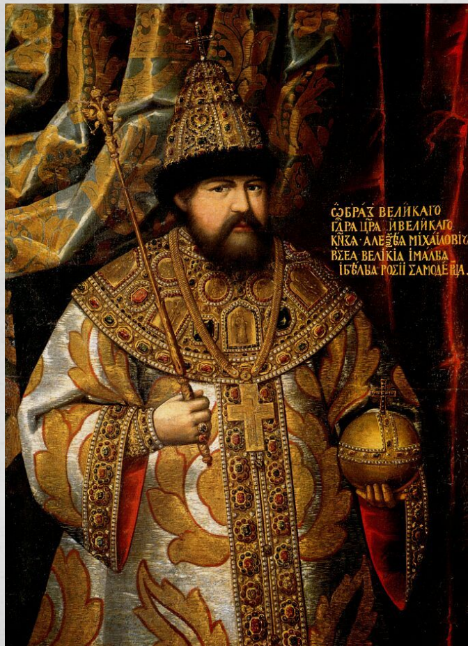
Алексей Михайлович Тишайший (1645 – 1676 гг.)