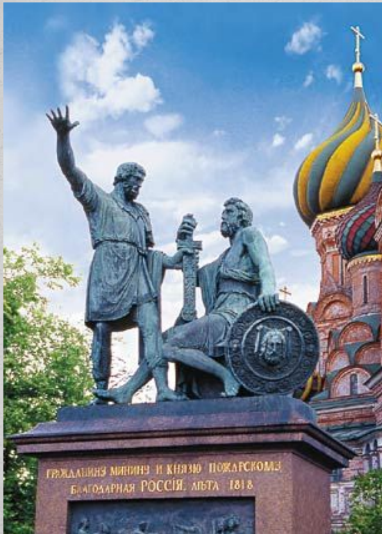
Скульптор И. П. Мартос

Октябрь 1611 г. – создание ополчения в Нижнем Новгороде под командованием Козьмы Минина и кн. Дмитрия Пожарского