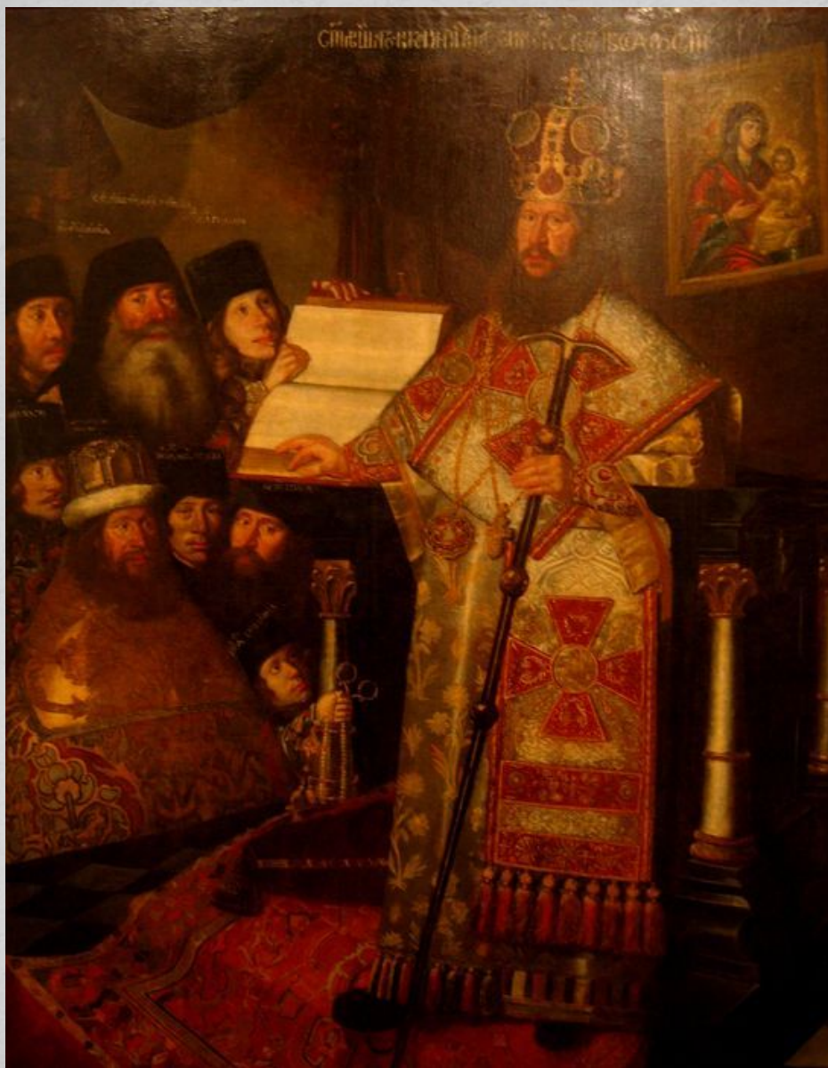
Патриарх Московский и всёя Руси Никон (Никита Минов) Избран в 1652 г.