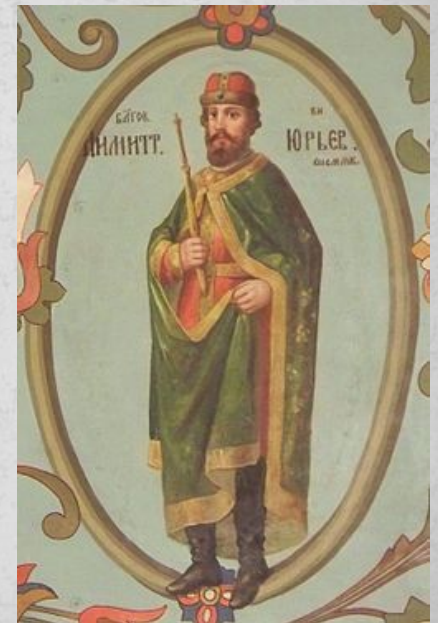
Дмитрий Юрьевич Шемьяка