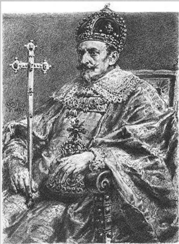
Польский король Сигизмунд III

В сентябре 1609 г. осадил Смоленск, который удалось взять после полутора лет