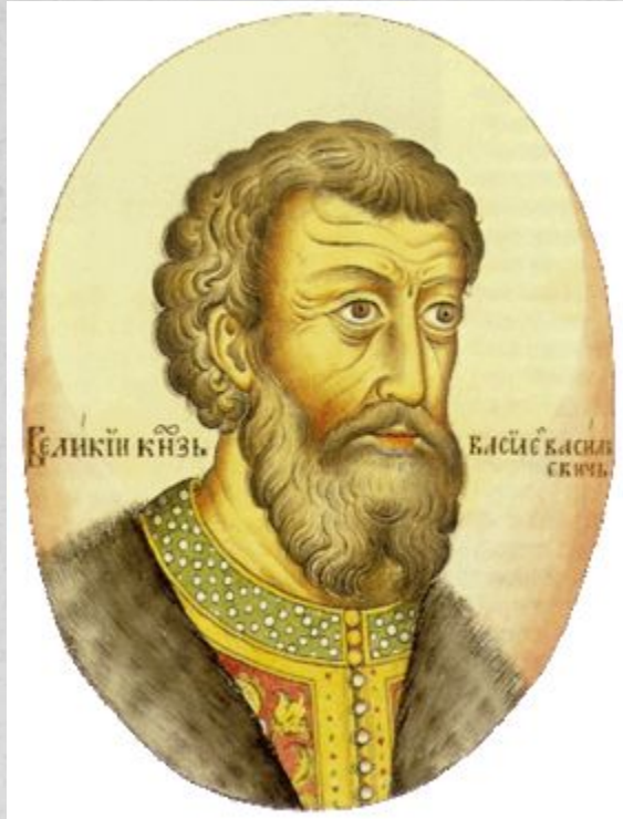
Великий князь Василий II Васильевич Тёмный