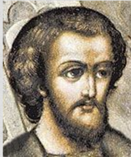
Юрий IV Дмитриевич (1374 — 1434) — звенигородский и галицкий князь