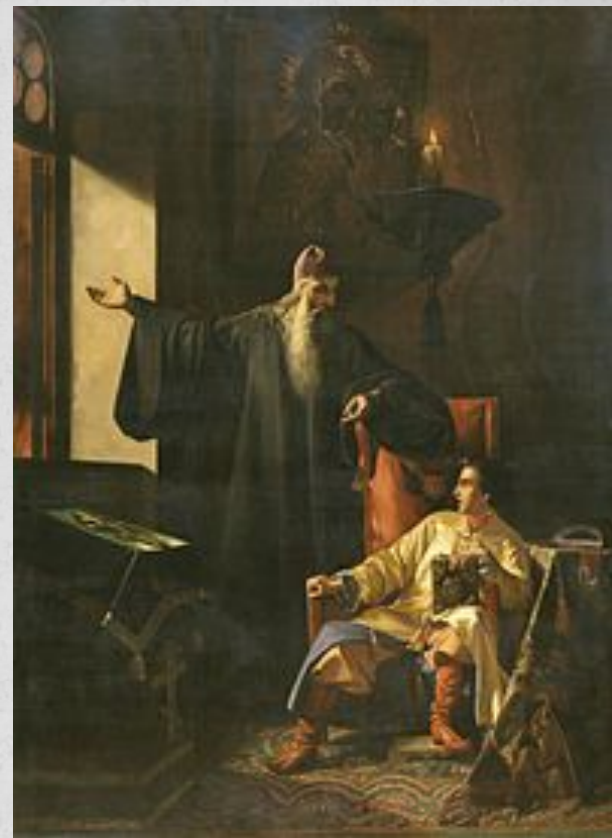
Иван IV и протопоп Сильвестр во время большого московского пожара 24 июня 1547 года (Павел Плешанов, 1856 год)