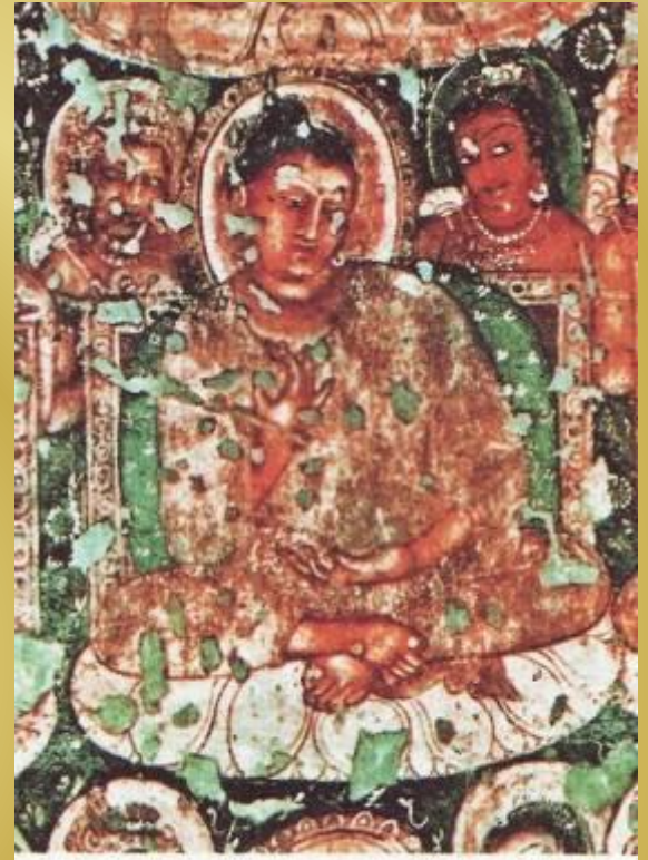
Будда, сидящий на лotosовом троне. VI—VII вв.