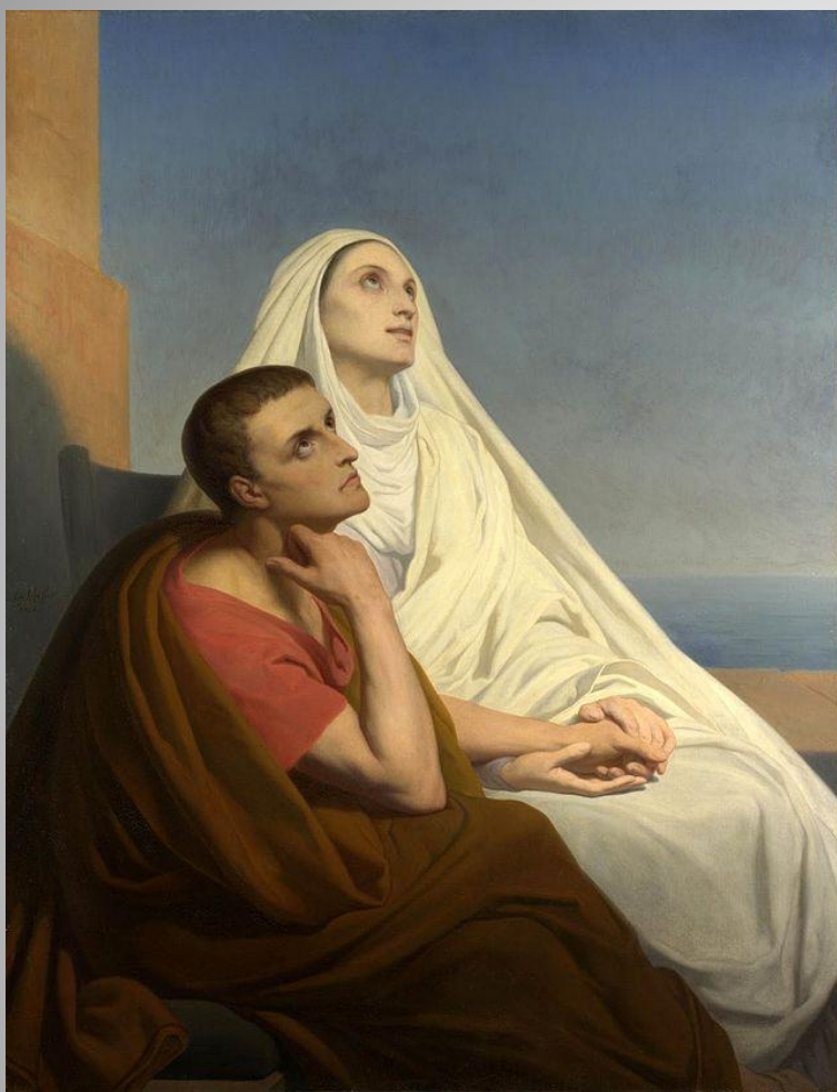
Святой Августин и Святая Моника