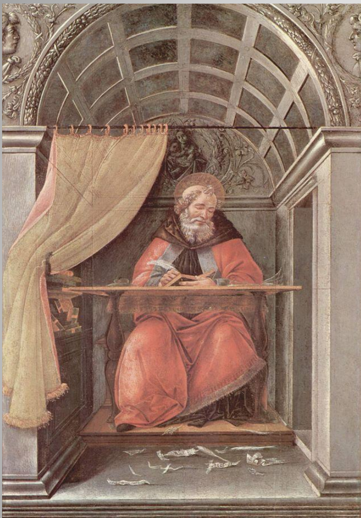
Боттичелли. «Св. Августин»

Августин Блаженный - родоначальник христианской философии истории (раздел философии, призванный ответить на вопросы об объективных закономерностях и духовно-нравственном смысле исторического процесса).