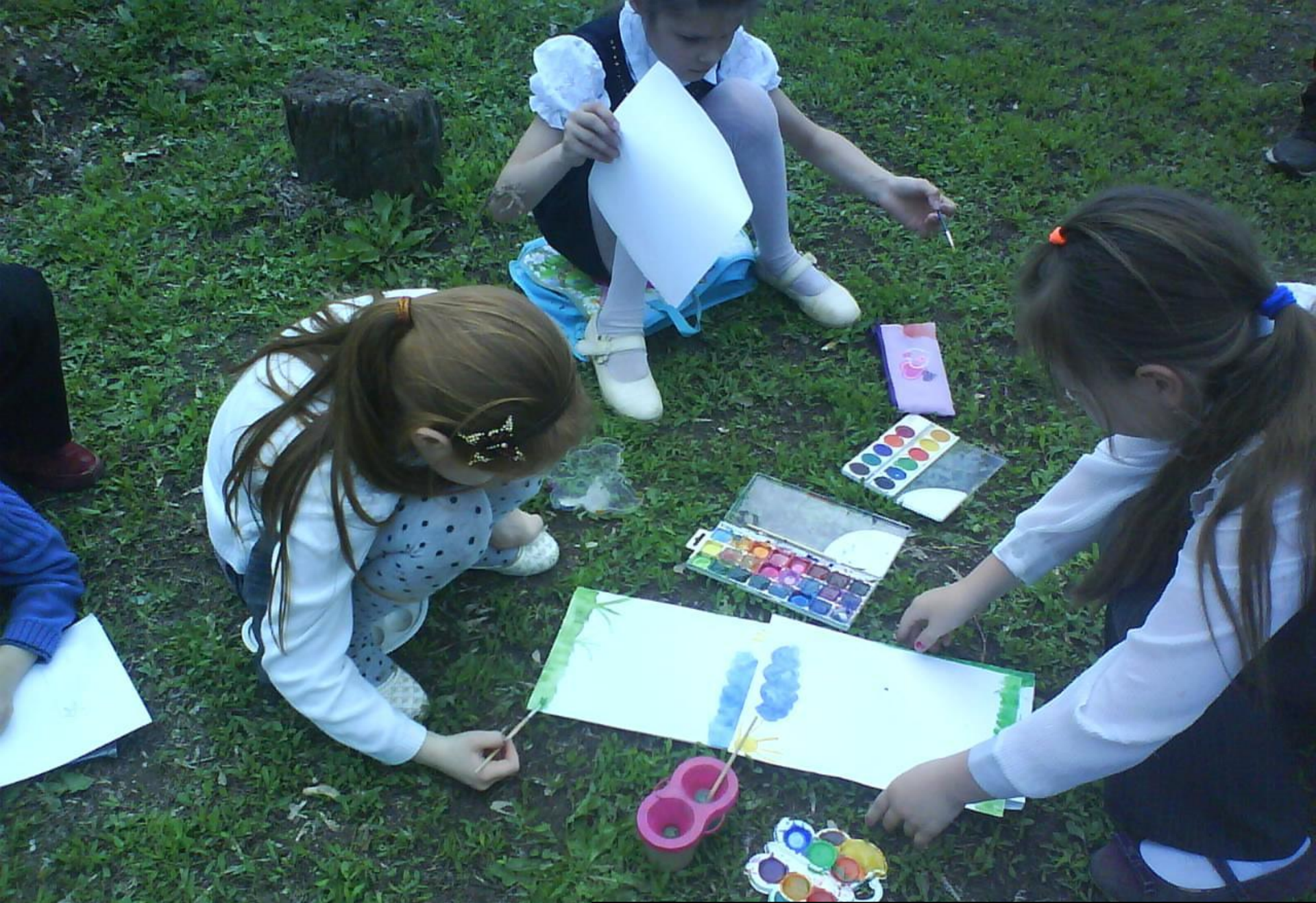
Рисуем на природе