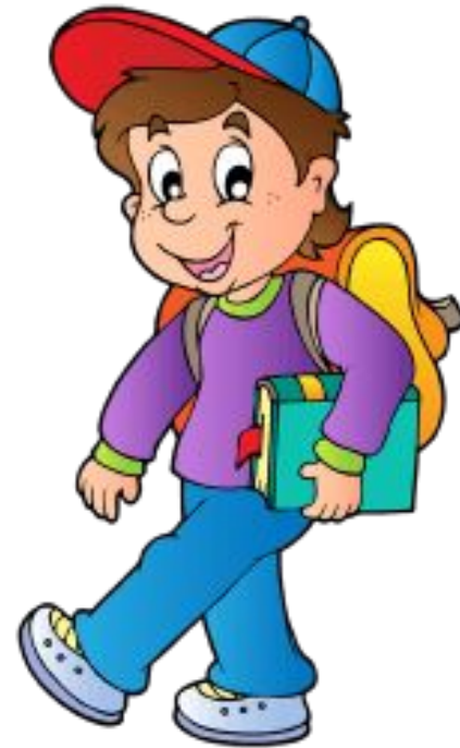
Володя пошёл в школу.