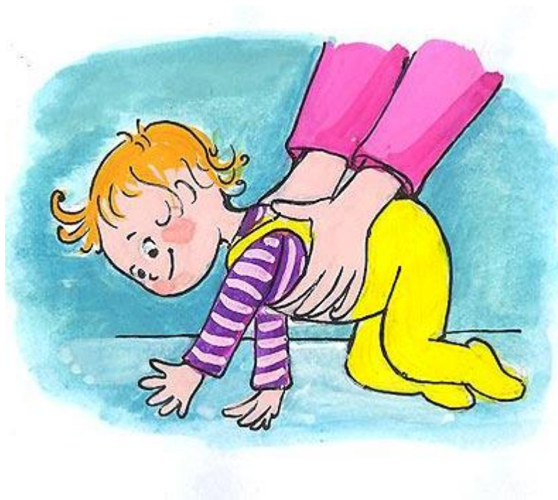
Малыш ползёт по полу.