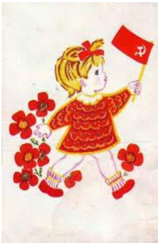
Лада взяла флажок.