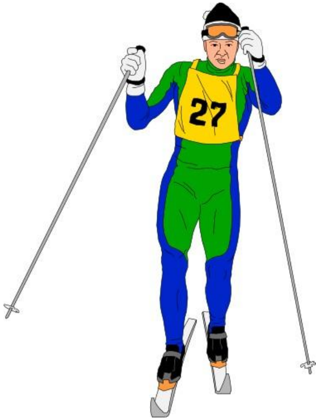
Лыжник идёт на лыжах.