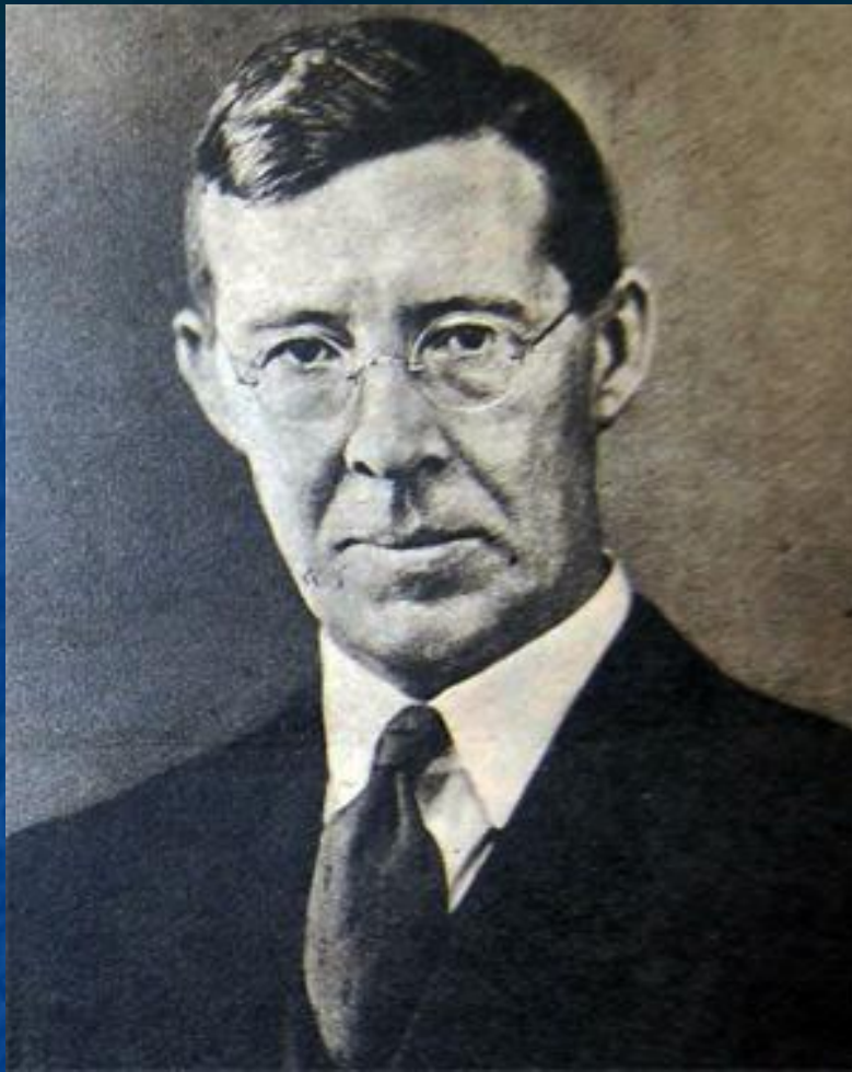
Питирим Сорокин 1889-1968 гг.

Ввел понятие «социальная мобильность» - любой переход индивида или социального объекта, т.е. всего того, что создано или модифицировано человеческой деятельностью, из одной социальной позиции в другую.