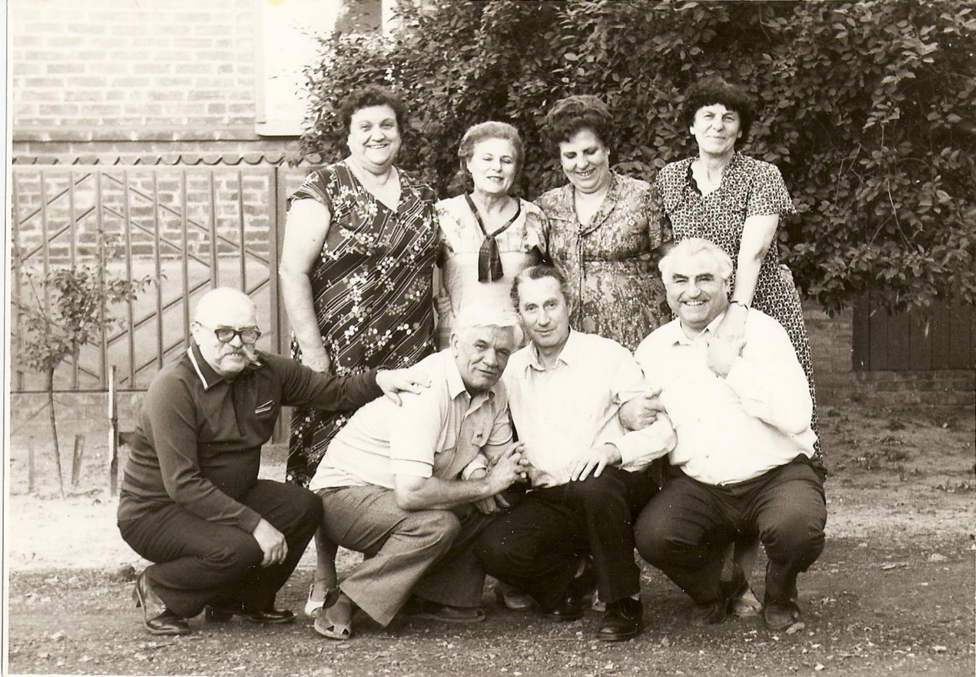
Петр Вениаминович был душой любой компании.