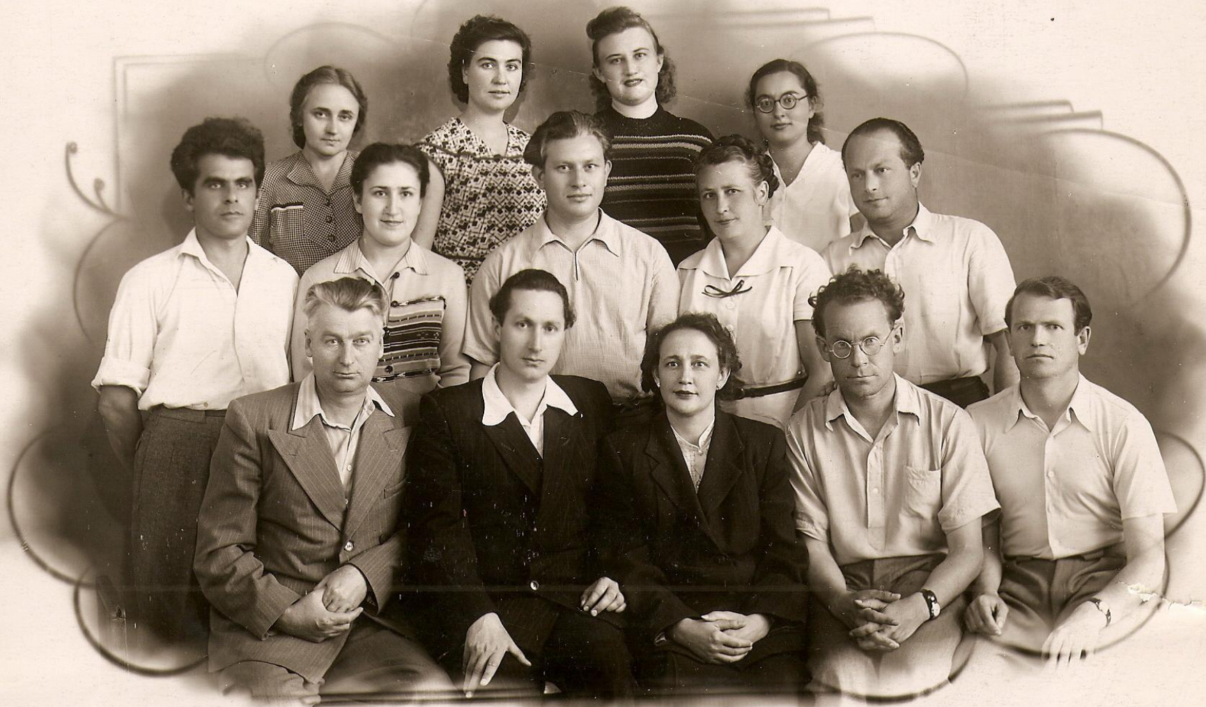
Кафедра иностранных языков ЛГУ. Июнь 1957г