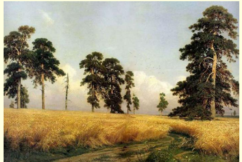
И. Шишкин. «Рожь»