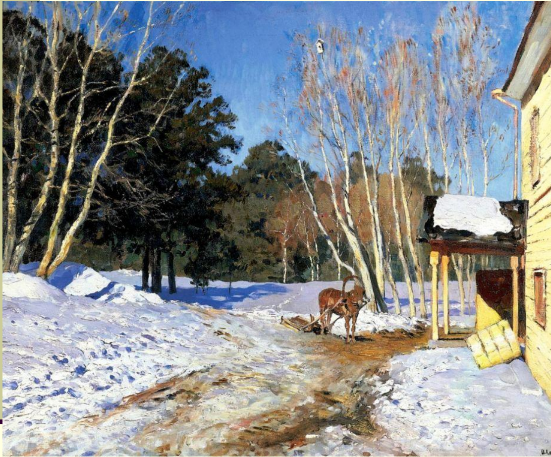
И. Левитан "Март"

Красота-то, какая! В голубом небе тоненькие веточки берез переливаются разными цветами. Их белые стволы словно светятся, а за ними темная зелень сосен. Высоко-высоко на березе темный скворечник ждет своих жильцов. Природа погружена еще в зимний сон, но снег на крыше крыльца подтаял, на дороге потемнел, стал рыхлым. А тени голубые-голубые! Сугробы потеряли свою белизну, осели... И все вокруг залито солнцем!