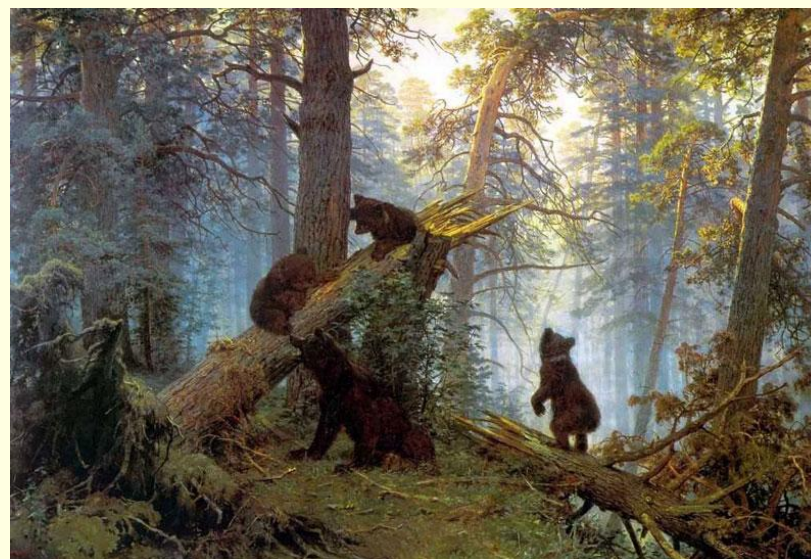
И.Шишкин. «Утро в сосновом бору»