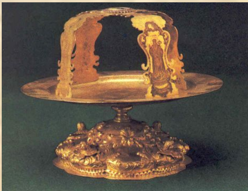
Дискос со звездой