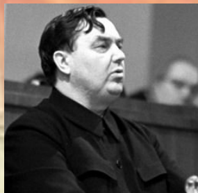
Георгий Максимилианович Маленков