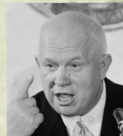
Никита Сергеевич Хрущев

министр Внутренних дел и Государственной безопасности СССР