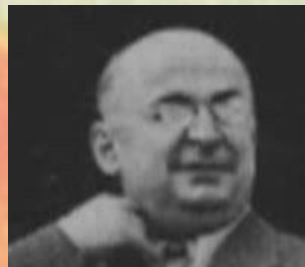
Лаврентий Павлович Берия

министр Внутренних дел и Государственной безопасности СССР