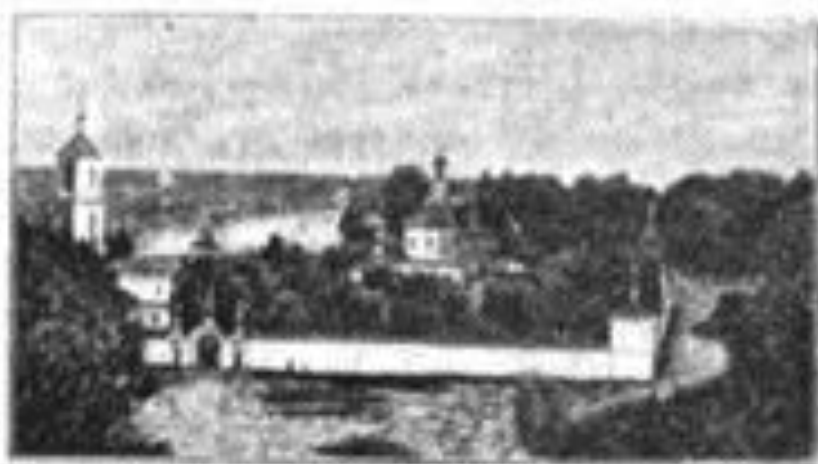
Моденскій Николаевскій м., въ Устюжнскомъ у

Храмовъ два: во имя св. Николая Чудотворца и въ честь Богоявленія Господня. Въ главномъ храмѣ находится чудотворная явленная икона Николая Чудотворца. Эта икона съ крестнымъ ходомъ 12 октября носится въ городъ Устюжну и остается тамъ для служенія молебновъ до 14 ноября. Съ открытіемъ навигаціи по рѣкѣ Мологѣ ходятъ пароходы изъ Рыбинска до Устюжны. При Моденскомъ монастырѣ устроена паровая пристань.