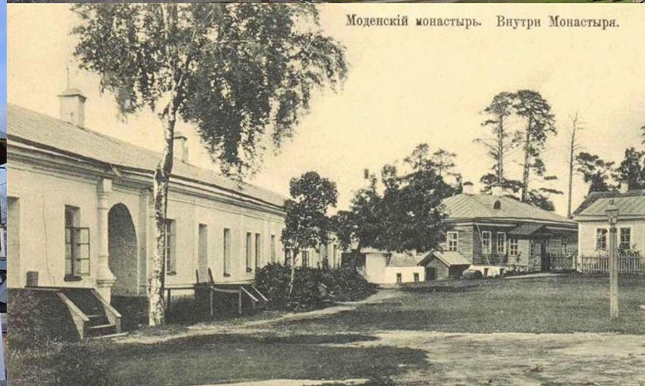
Моденский монастырь. Внутри Монастыря.