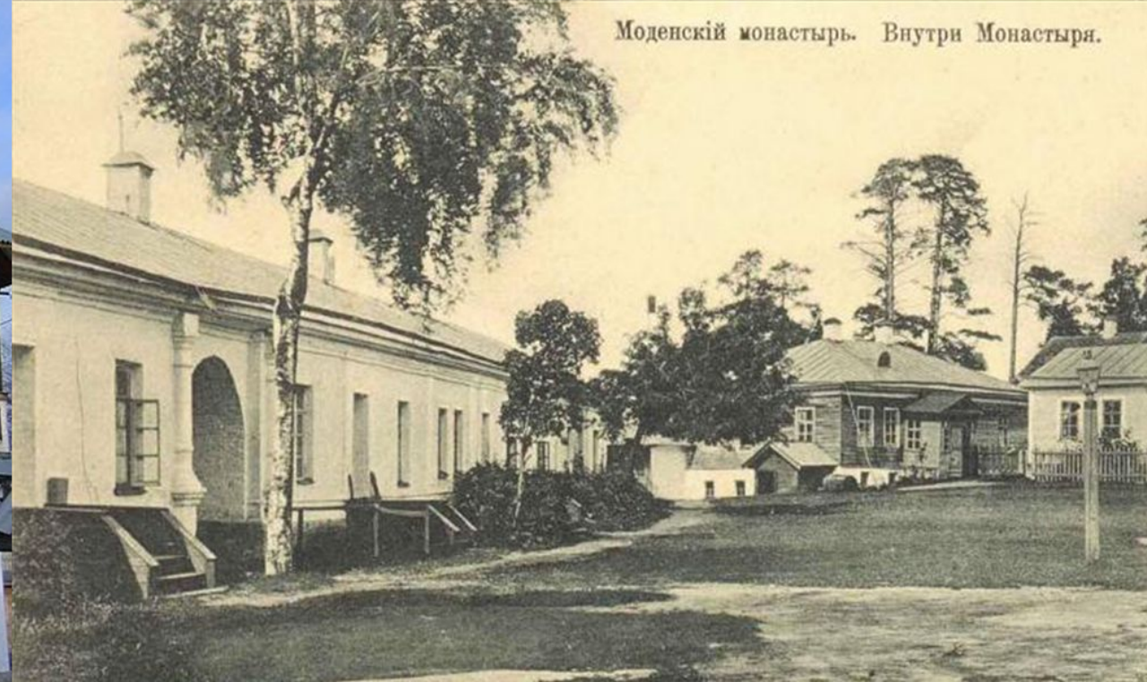
Моденский монастырь. Внутри Монастыря.