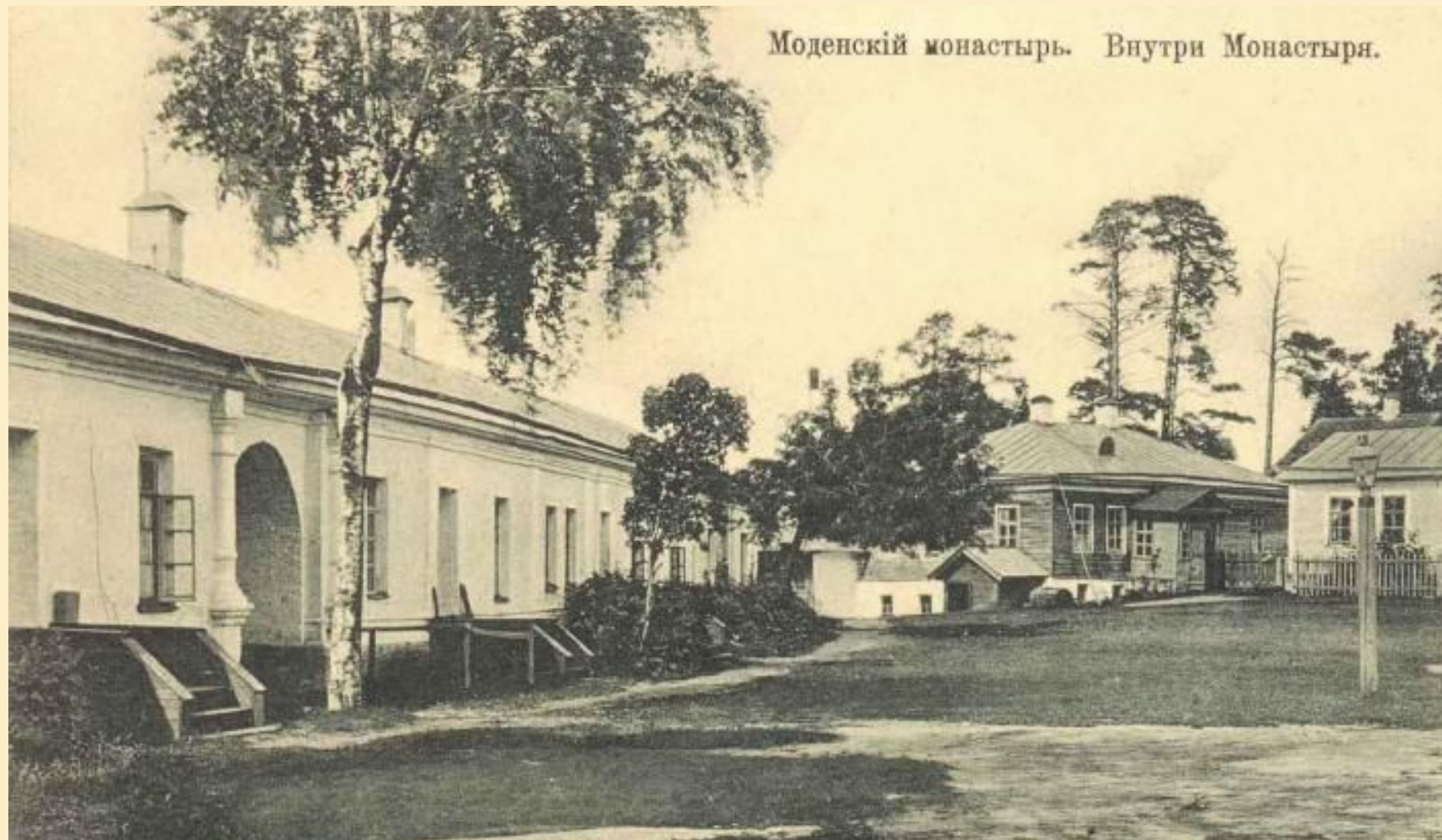
Моденский монастырь. Внутри Монастыря.