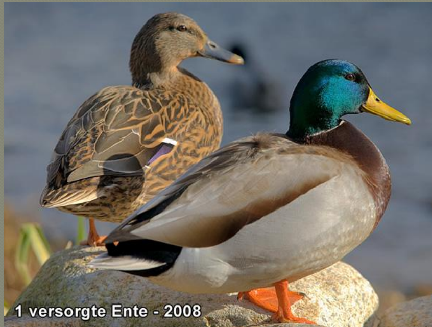
1 versorgte Ente - 2008