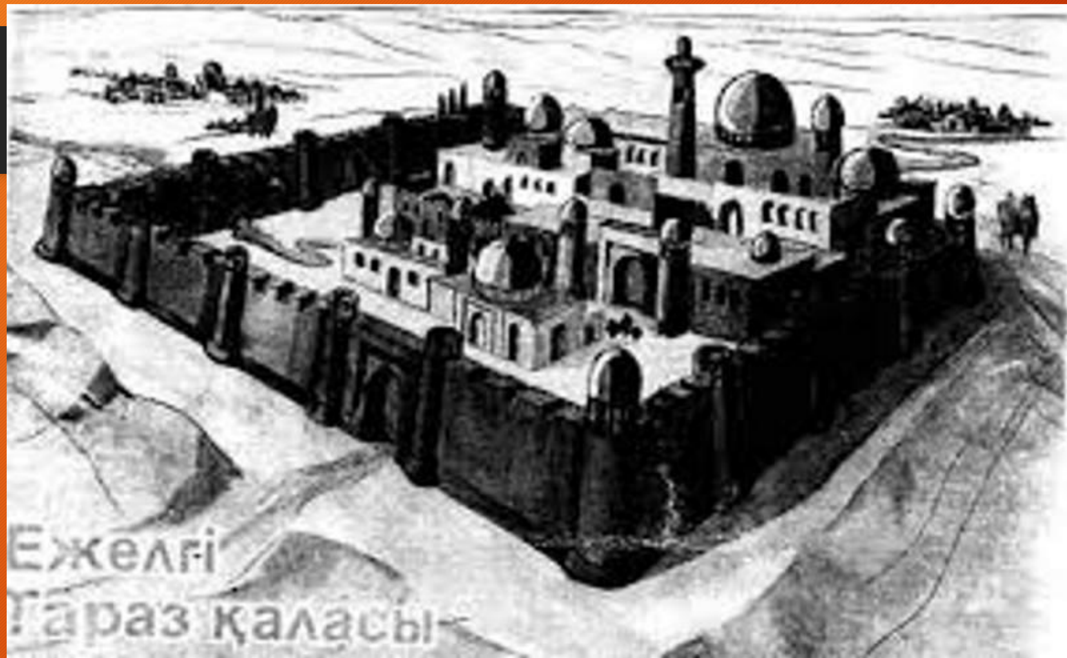
Ежелгі Тараз қаласы