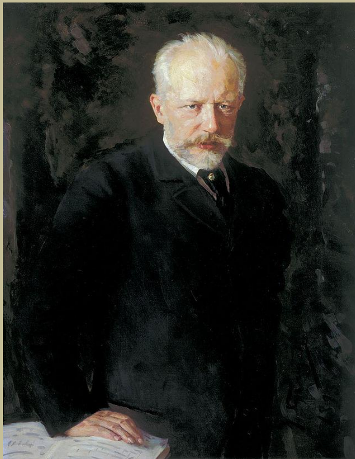
3.1. Н.Д.Кузнецов «Портрет П.И.Чайковского» 1906 год.