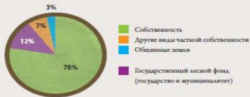
Формы собственности на лесной фонд (%)