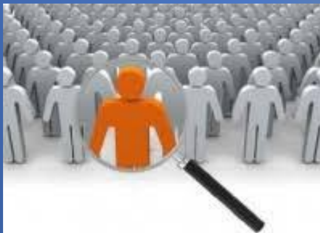
Особа і соціум