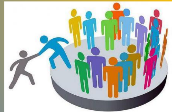
Суспільство і ви