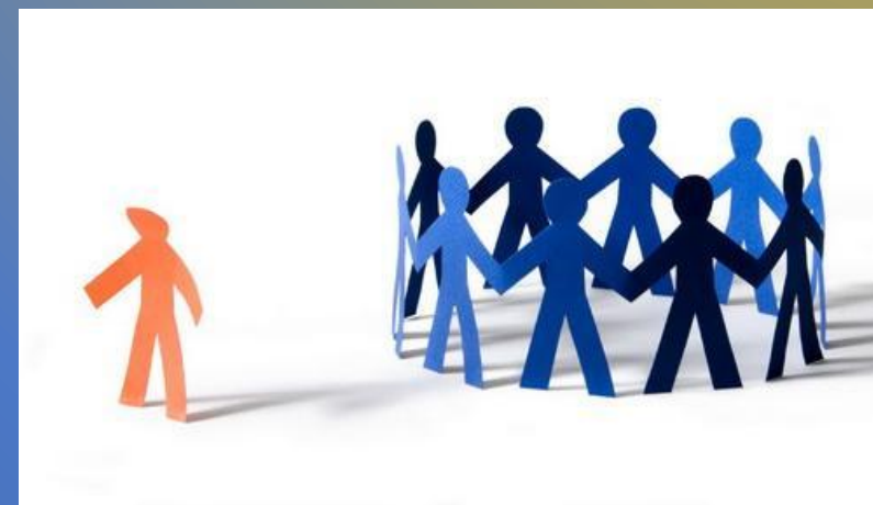
Ви і суспільство