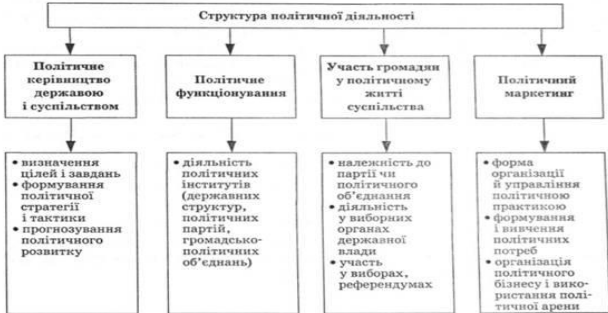
Рис. 4.2. Структура політичної діяльності