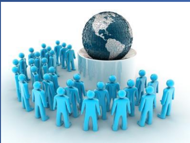
Людина і світ