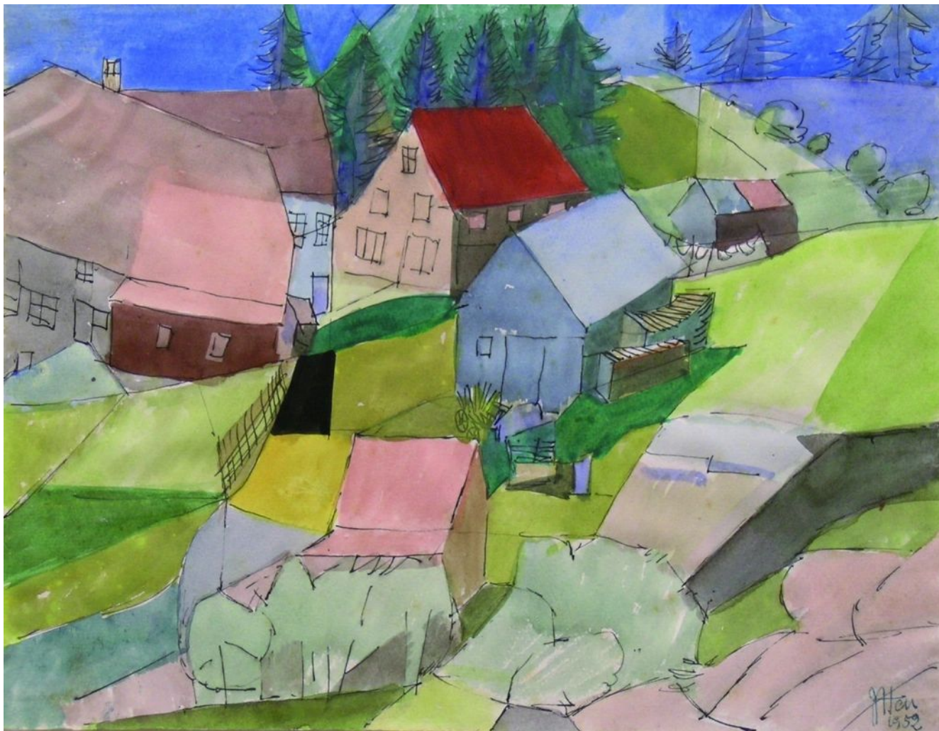
«Дома в Швейцарии»