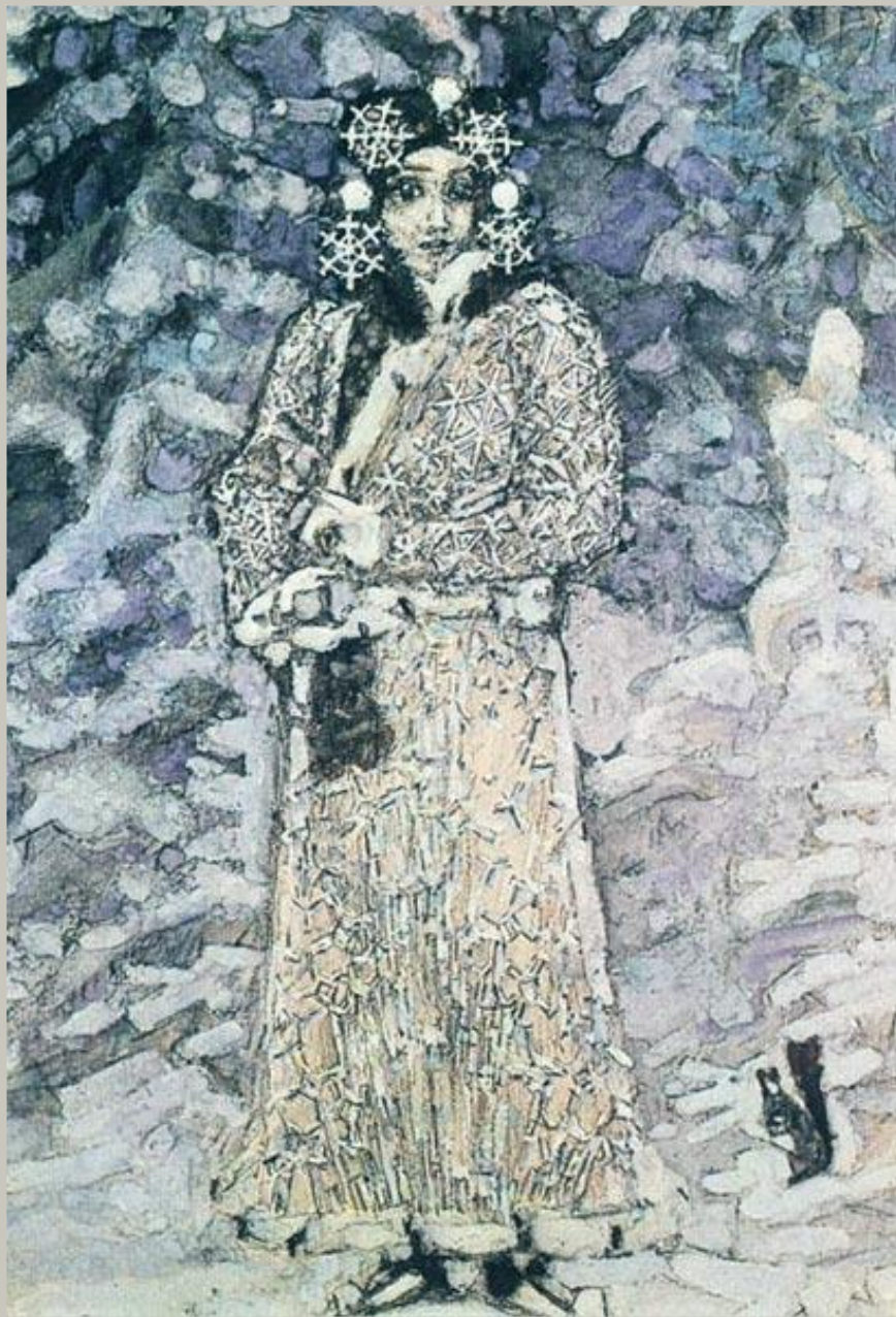
Художник Михаил Врубель "Снегурочка" 1890