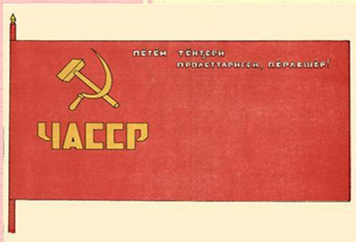
Государственный флаг Чувашской АССР 1931–1938

Герб состоит из изображений на красном фоне в золотых лучах солнца золотых серпа и молота, расположенных крест-накрест рукоятками книзу, окруженных венком, состоящим из колосьев с правой стороны и дубовых и еловых веток с левой стороны, перевитым снизу красной лентой с надписью в середине: «Пётём тёнчери пролетарисем, пёрлешёр!» Над серпом и молотом помещается золотая пятиконечная звезда. Вокруг венка надпись с левой стороны: «Чӑвашсен Автономлӑ Сотс. Сов. Республӑкӑ», с правой стороны - «Чувашская Авт. Совет. Соц. Республика» и внизу, между вышеуказанными надписями «РСФСР»