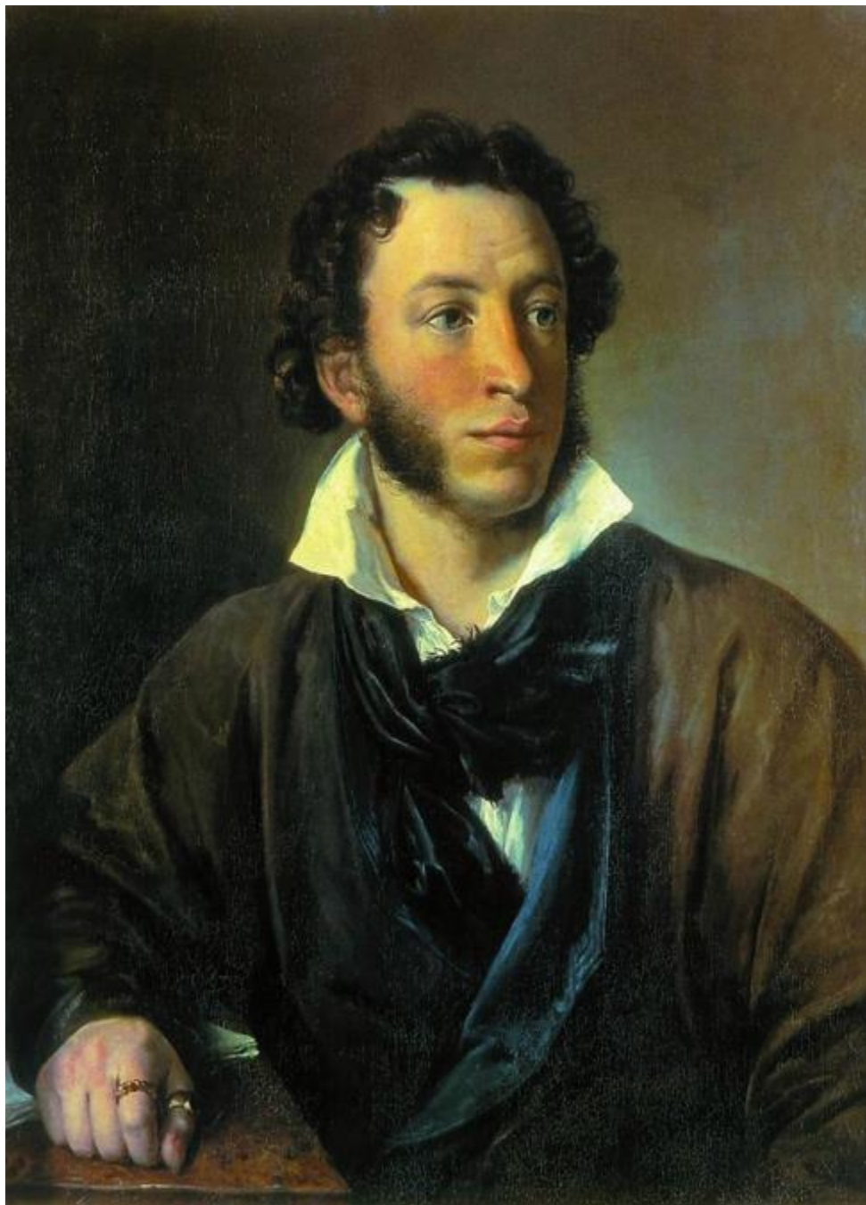
Портрет А. С. Пушкина