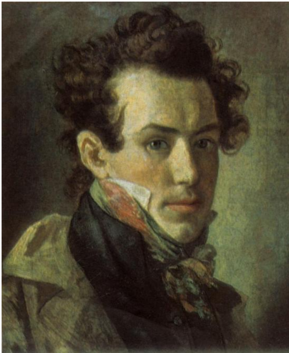
Портрет В. А. ЖуковСКОГО