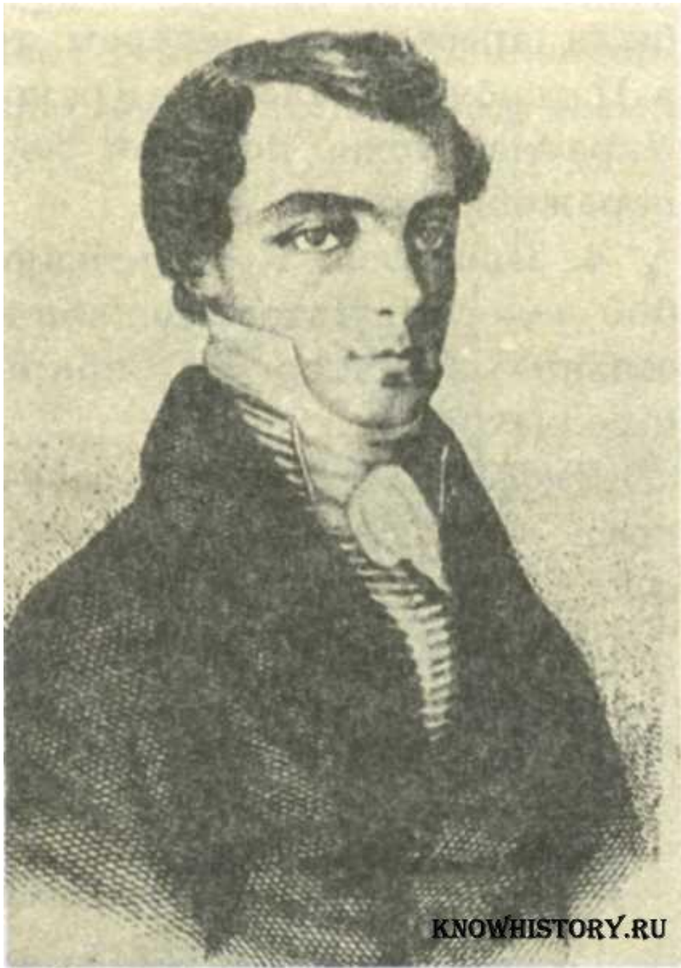
К. Ф. Рылов