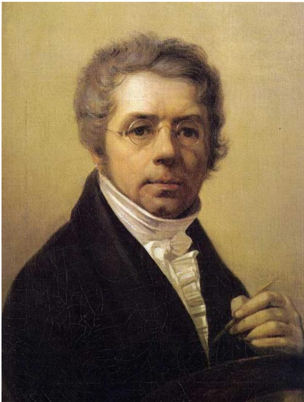
А. Г. Венецианов