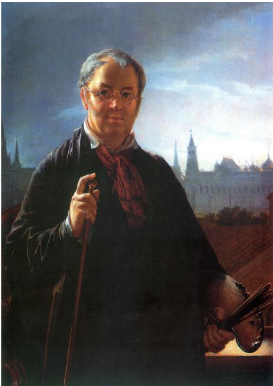
В. А. Тропинин