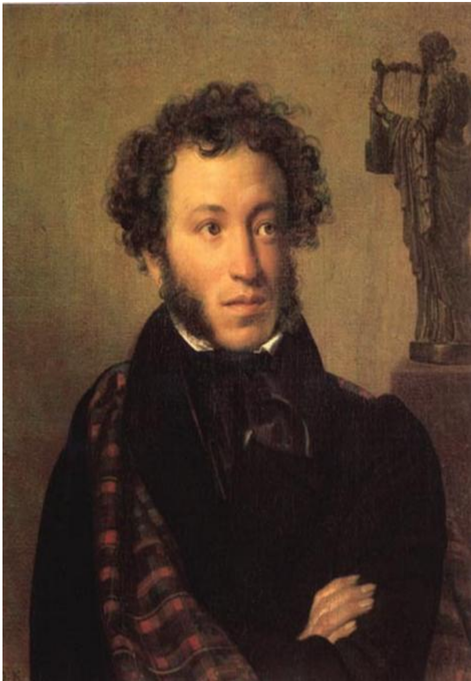
Портрет А. С. Пушкина