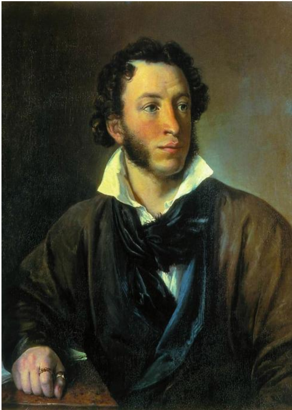
А. С. Пушкин