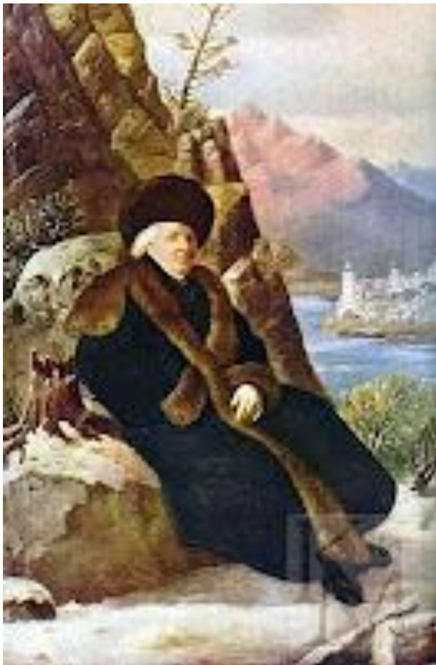
Г. Р. Державин