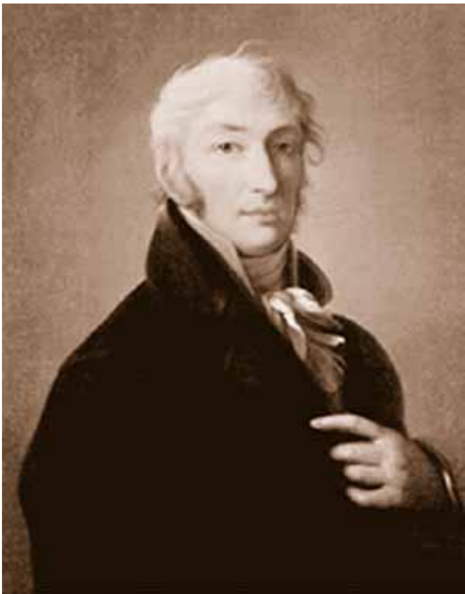
Н. М. Карамзин