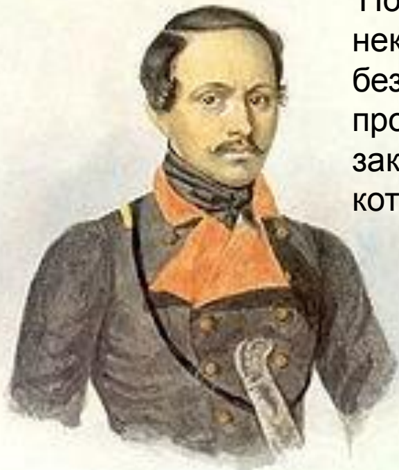
Последний прижизненный портрет М. Ю. Лермонтова в сюртуке офицера Тенгинского пехотного полка. 1841 г. Художник К. А. Горбунов

По дороге в полк Лермонтов остановился на некоторое время в Пятигорске. Здесь у него, не без тайных интриг жандармских чинов, произошла ссора в Мартыновым, закончившаяся 15 июля 1841 г дуэлью, на которой поэт был убит.