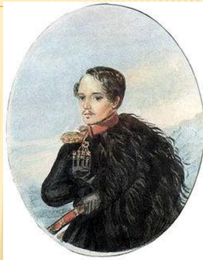
□ Бумага, акварель. Государственный литературный музей. Москва