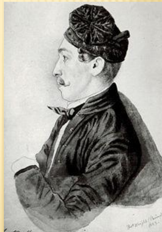
Н. С. Мартынов, убивший Лермонтова на дуэли