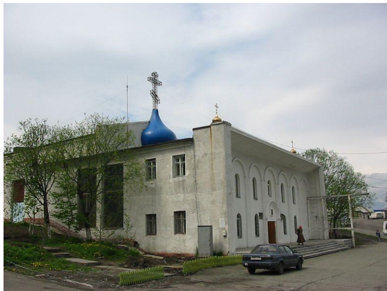
Святых апостолов Петра и Павла