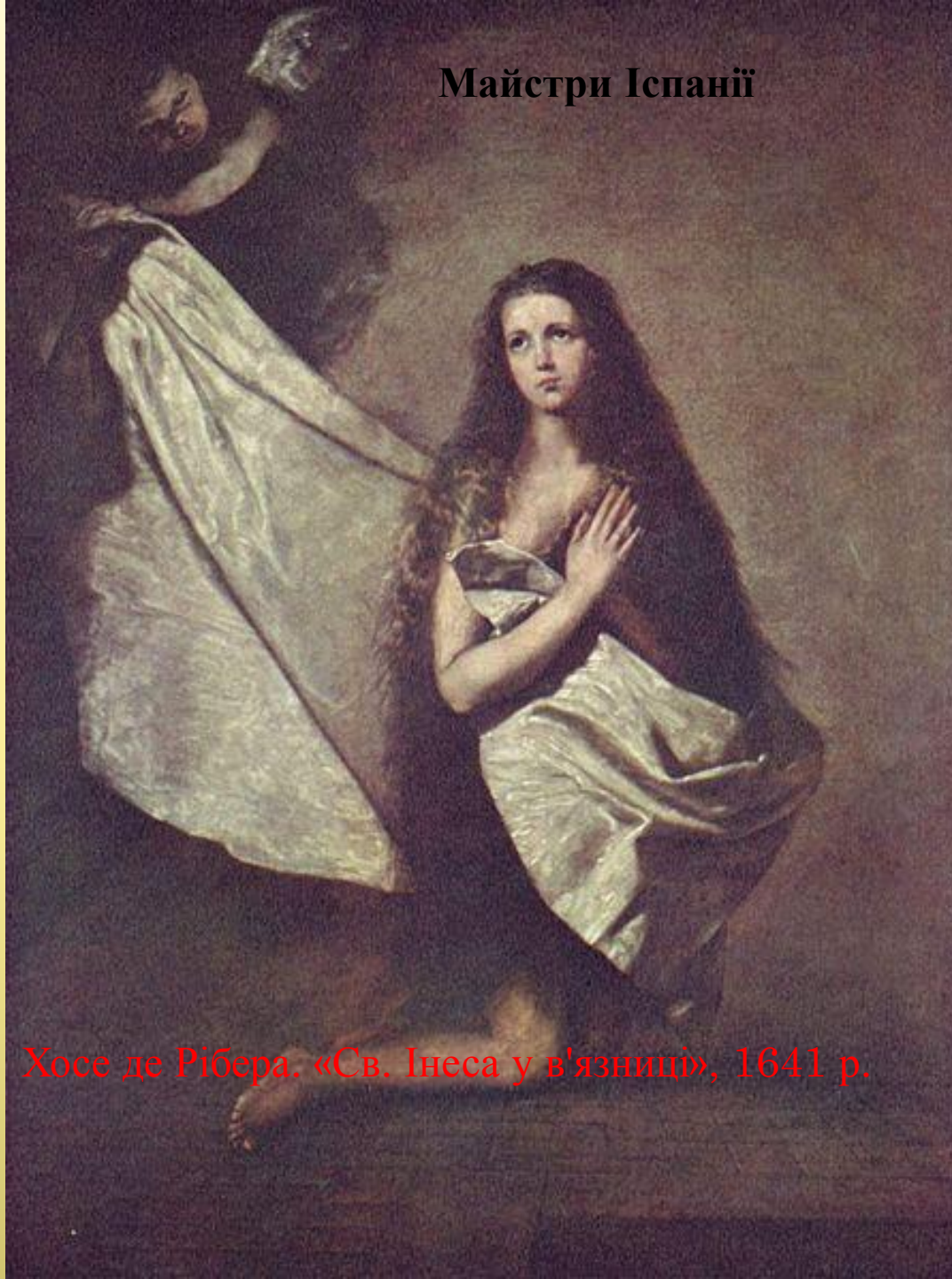
Хосе де Рібера. «Св. Інеса у в'язниці», 1641 р.