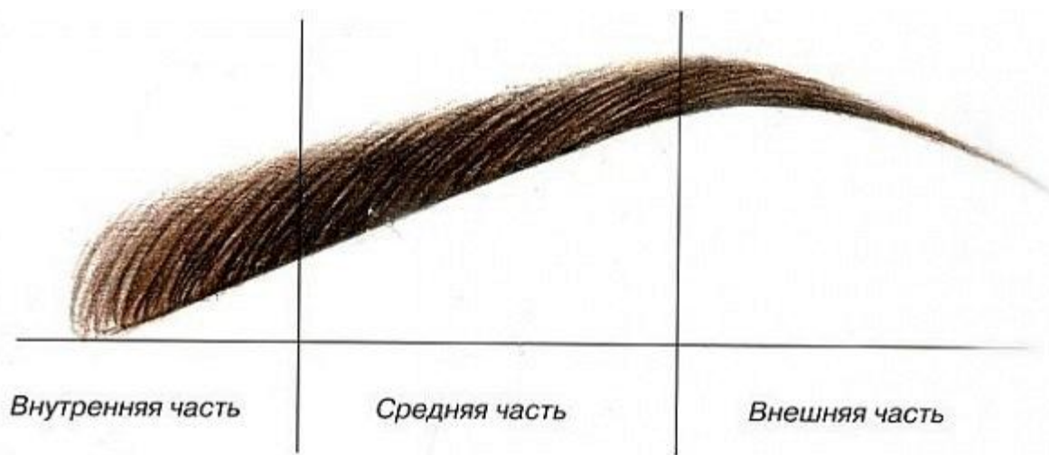
Рис. 1. Стрoение бровей