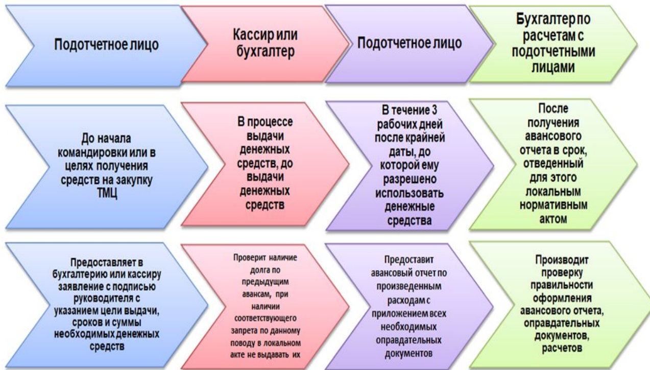
Рисунок 2 - Алгоритм выдачи средств под отчет