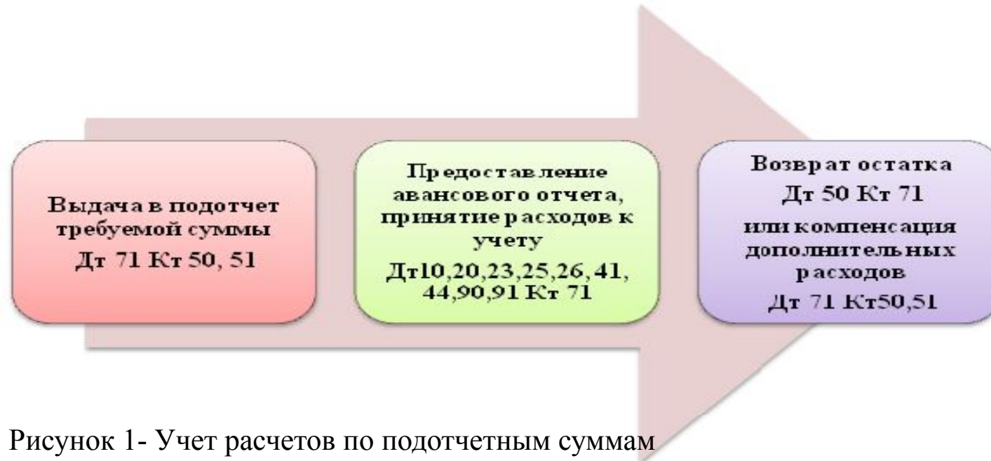
Рисунок 1- Учет расчетов по подотчетным суммам