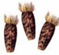
Плоды лопуха (репейника)