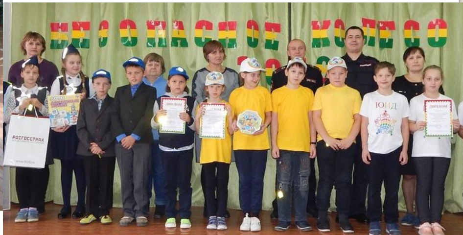
МКОУ "Корцовская СОШ" На «Безопасном колесе».