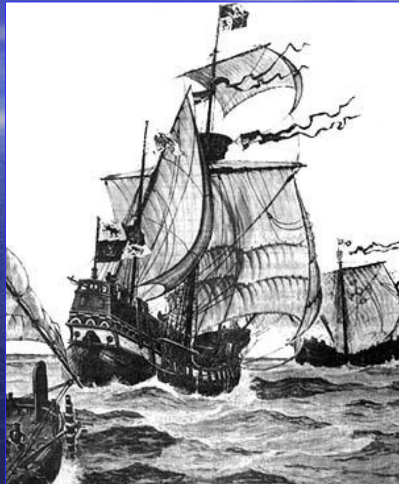
Корабли экспедиции Христофора

Росло число врагов Колумба среди дворян, недовольных тем, что он сурово карал участников экспедиции за непослушание. В 1500 г. Колумб был смещен со своего поста и в оковах отправлен в Испанию. Ему удалось восстановить свое доброе имя и совершить еще одно путешествие в Америку. Однако после возвращения из последнего путешествия он был лишен всех доходов и привилегий и умер в бедности.